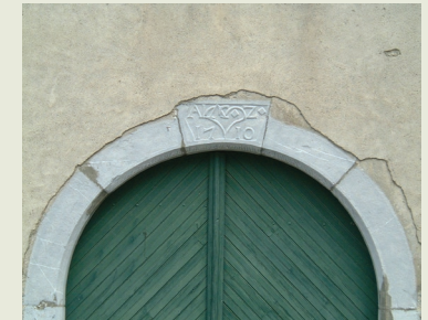
Arc de plen cintre - 1710