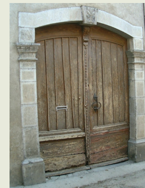
Arc segmentari - 1869