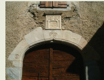
Arc en ansa de tistèth - 1777