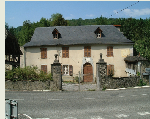
Lobier de Baish

Que cau totun mentàver que las maisons deus dus vilatges mei hauts en vath d'Aspa, Lhers e Lascun, que son maisons « en largor ».