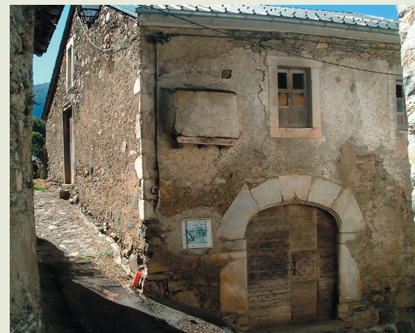
Lobier de Haut

Los bastiments mei ancians qu'avèvan sonque ua pòrta grana de dus alands. Dab lo temps qu'ei estadada doblada per ua pòrta pedanhèra qui mia tau lotjament.