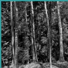
Arboretum de Payssas, Lasseube

03/10 14h30 / BALADE PAYSAGÈRE / Lasseube / Visite commentée de l'arboretum de Payssas par le propriétaire et le CAUE 64 - covoiturage possible depuis la médiathèque à Oloron à 14h00 16h30 / EXPOSITION / Médiathèque des Gaves / Présentation de l'exposition Portraits de jardins suivie de la remise des prix du concours photos Arbres et lumières dans le Piémont 17h30 / FILM / Villa du Pays d'Art et d'Histoire des Pyrénées béarnaises / Auditorium Bedat - Projection du documentaire Un architecte dans le paysage de Carlos LOPEZ - entrée libre 18h30 / BALADE PAYSAGÈRE / Parvis de la médiathèque des Gaves / Visite des jardins de la Confluence des Gaves par Anne-Gaëlle LE GUILLANTON paysagiste du projet et Valérie CAMPAGNE technicienne en charge du suivi du chantier à la Ville d'Oloron-Sainte-Marie