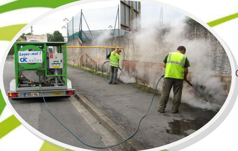
Dés herbage avec vapeur eau chaude