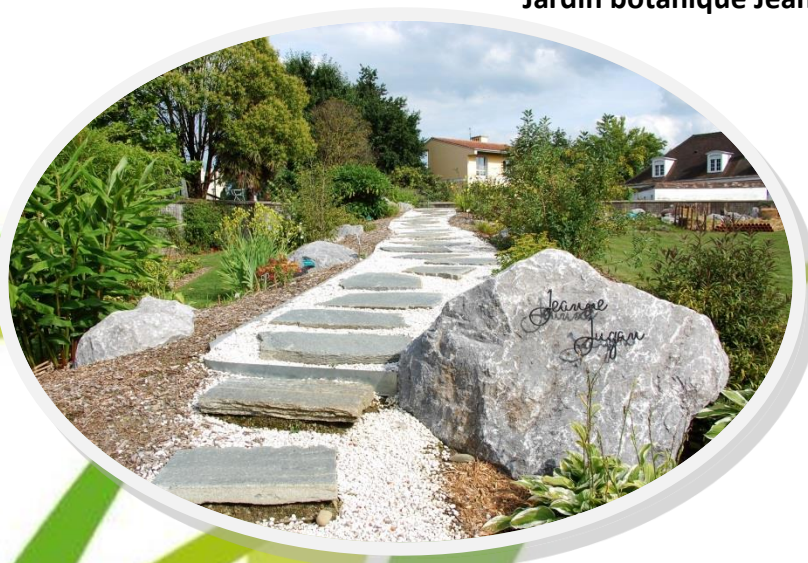
Jardin botanique Jeanne Jugan