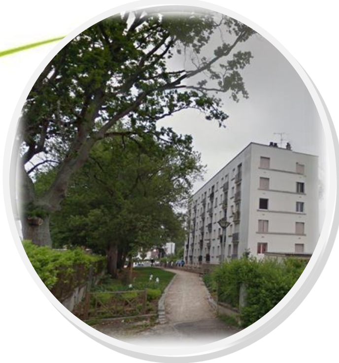
Passage Marie Laure