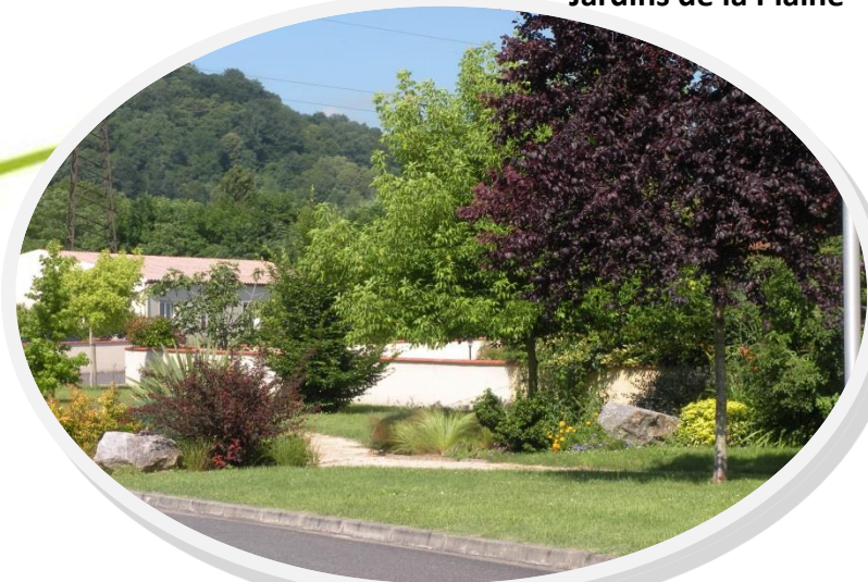
Jardins de la Plaine