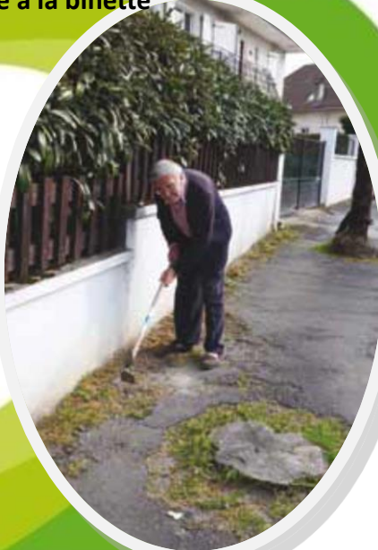
Dés herbage à la binette