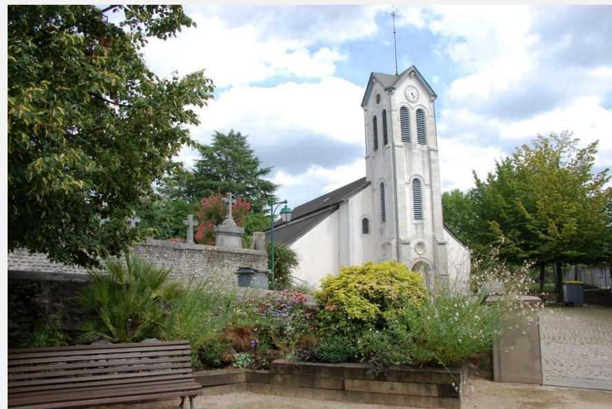
Square St Laurent