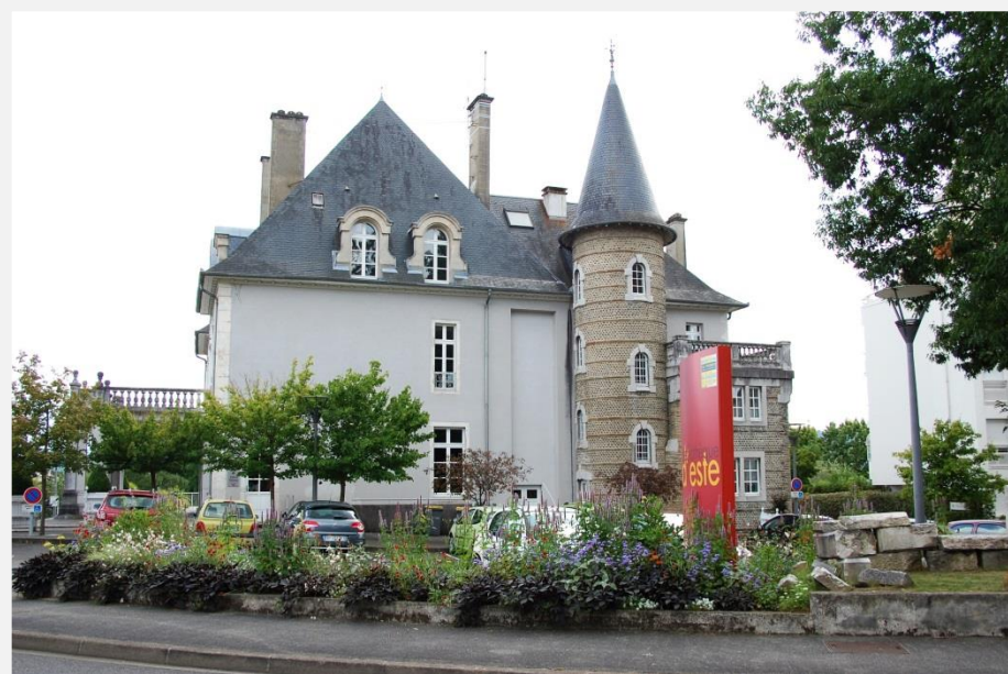
Médiathèque Château d'Este