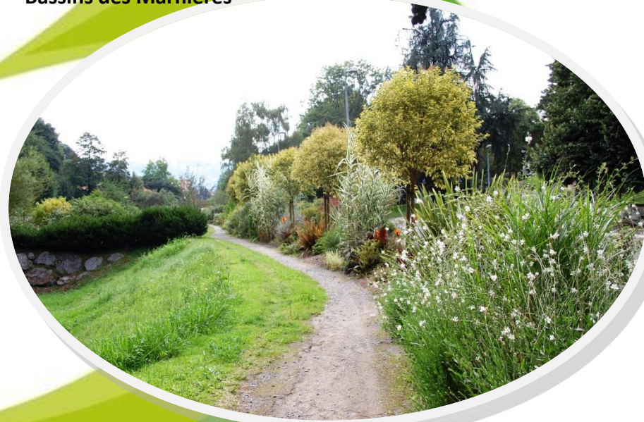
Bassins des Marnières