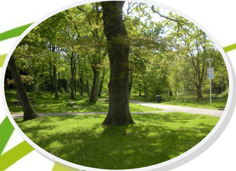
Bois du Lacaou