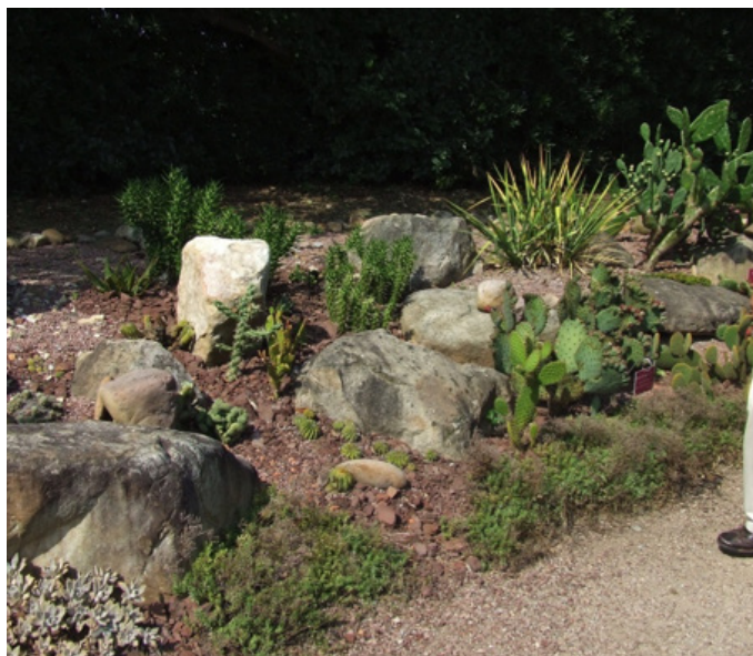
Fig. 15 – Le massif des plantes de rocaille