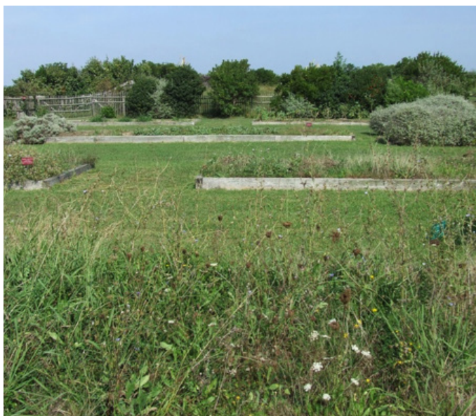
Fig. 12 – Les massifs rectangulaires présentent la végétation des landes