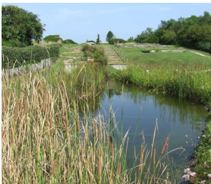
Fig. 16 – Une perspective sur la mare