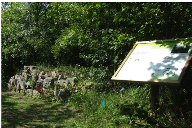
Fig. 9 – Les panneaux explicatifs jalonnent le jardin