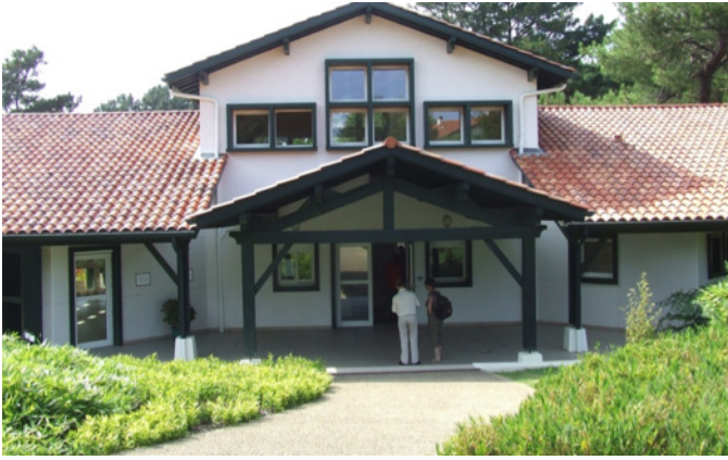
Fig. 3 – La maison Jean BOST à l'entrée du jardin