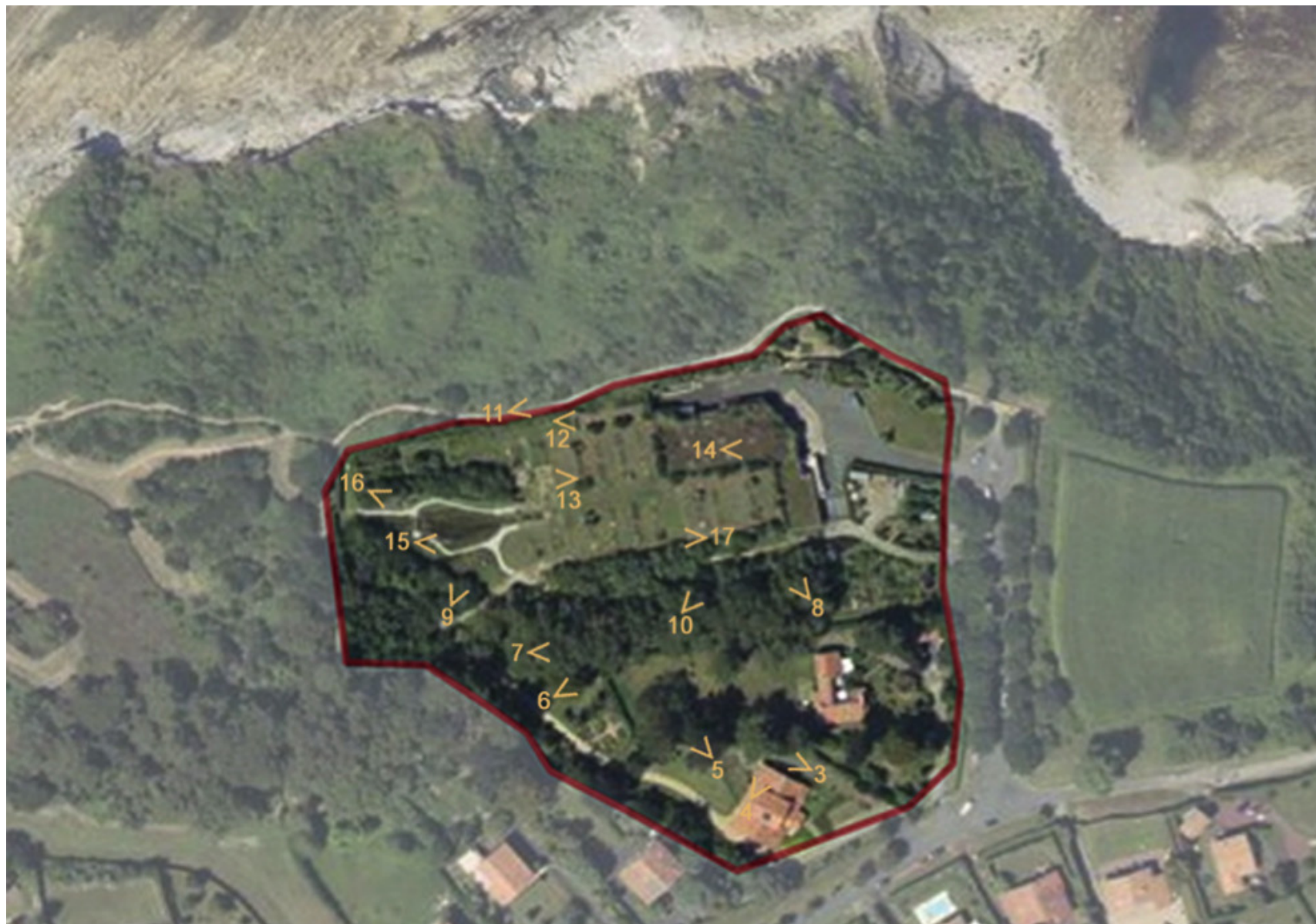
Fig. 1 - Vue aérienne du site et localisation des prises de vue