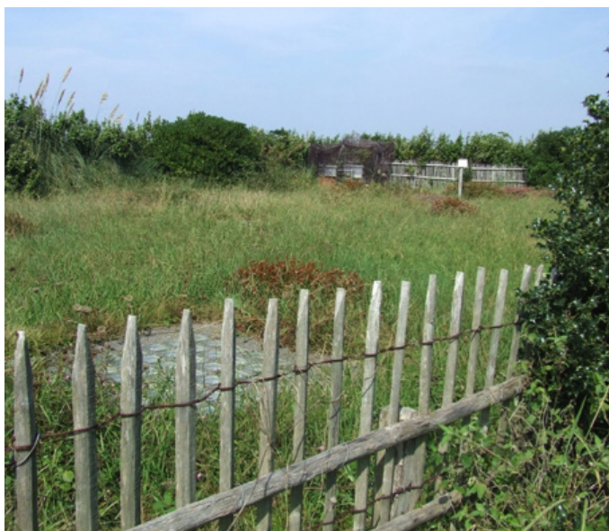
Fig. 14 – Le toit végétalisé de la station d'épuration enterrée