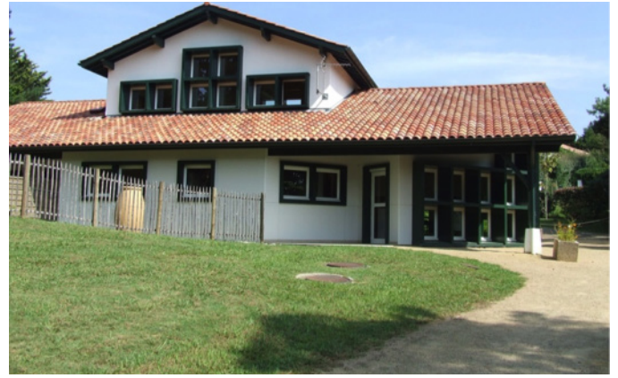
Fig. 4 – La façade Ouest de la maison d'accueil