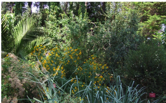
Fig. 8 – Une des riches compositions botaniques sous futaie