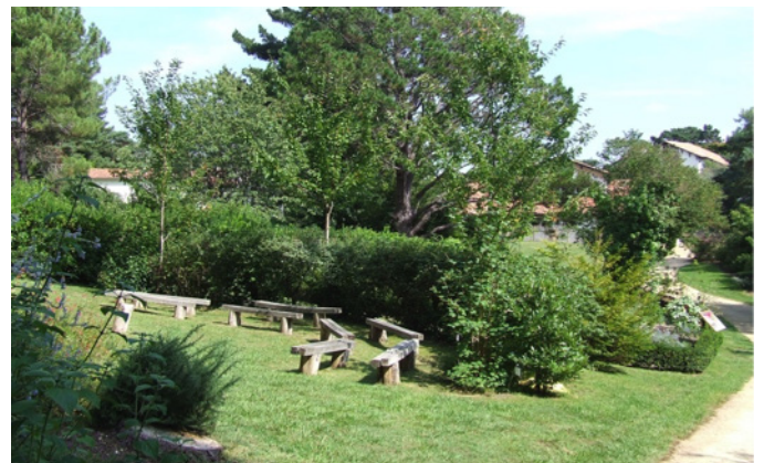
Fig. 7 – La « classe buissonnière », qui accueille de nombreuses animations ©CAUE 64