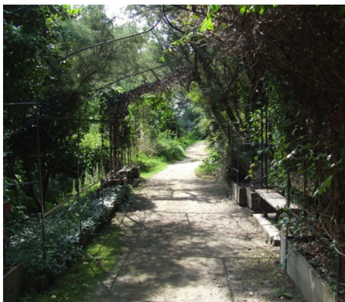
Fig. 17 – La pergola métallique soutient les plantes grimpantes