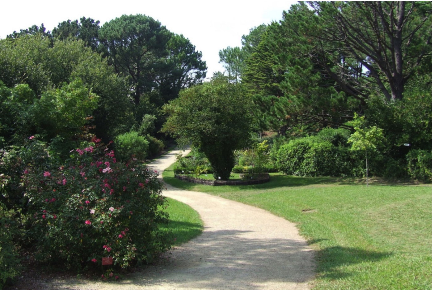
Fig. 5 – L'allée depuis la maison, bordée à gauche par la collection de plantes « des 5 continents », en arrière-plan les pins de la pinède