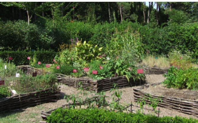
Fig. 6 – Les carrés en plessis de châtaignier du Jardin des Utiles