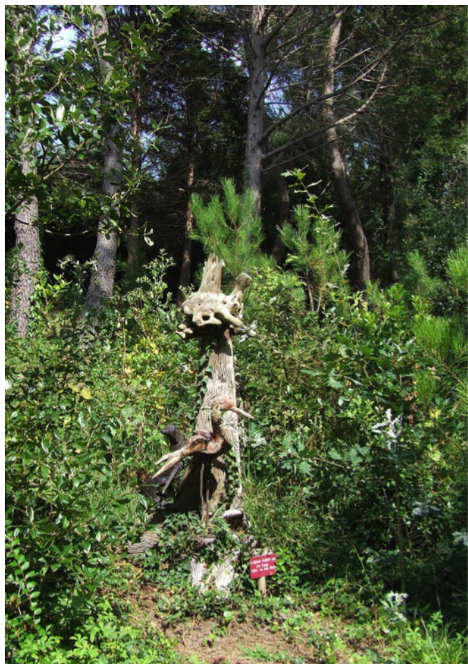
Fig. 10 – Une sculpture en bordure de la pinède-chênaie