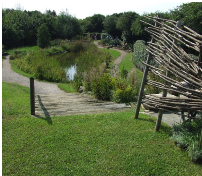
Fig. 13 – Descente vers la mare et les milieux humides