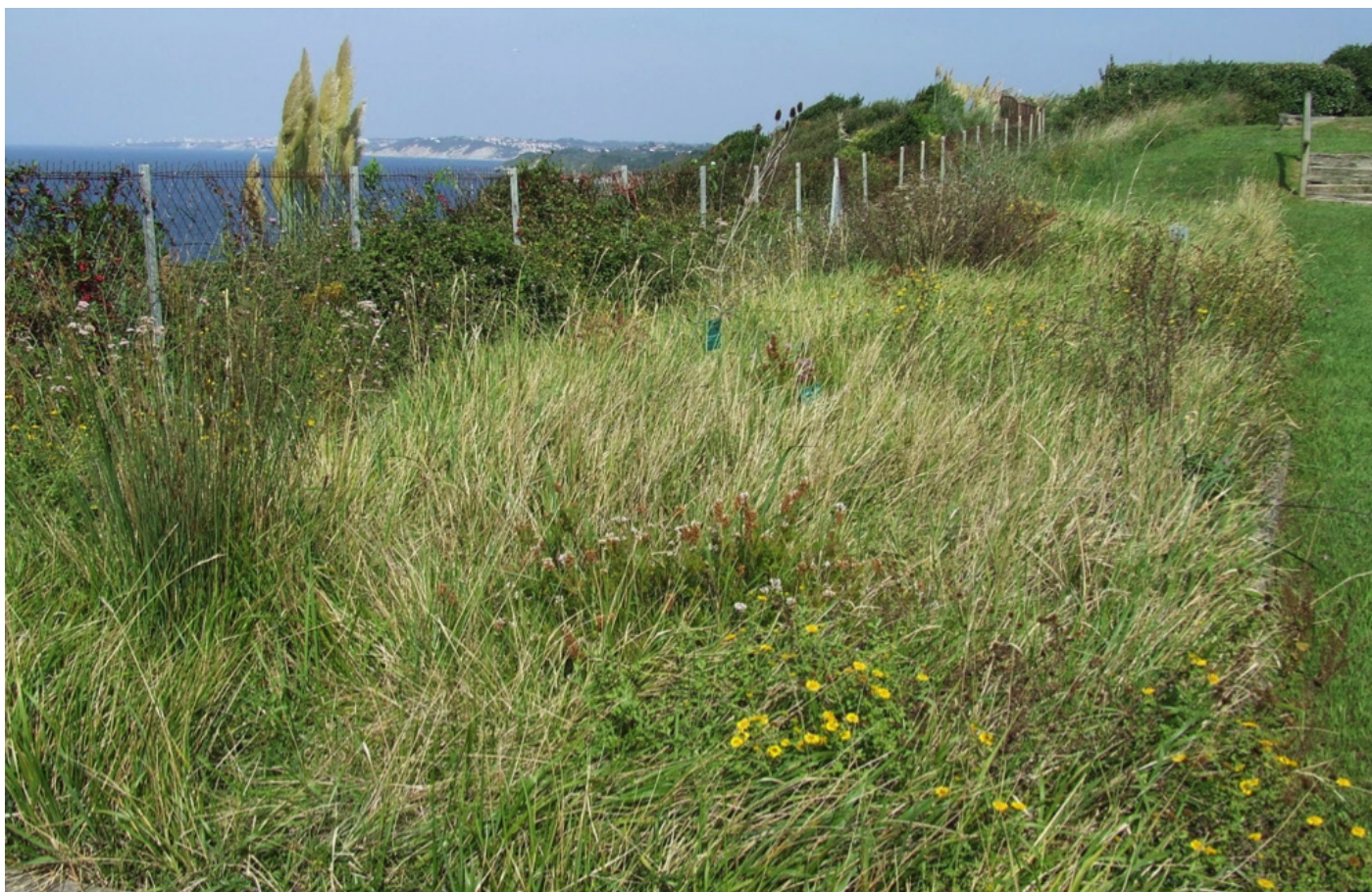
Fig. 11 – La situation du jardin sur la colline d'Archilua ouvre la vue sur l'océan et le littoral