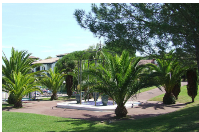
Fig. 11 - La gloriette, encadrée par les cyprès