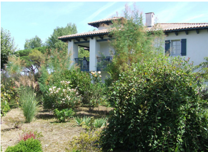
Fig. 5 - De nombreux massifs et petits jardins animent le domaine