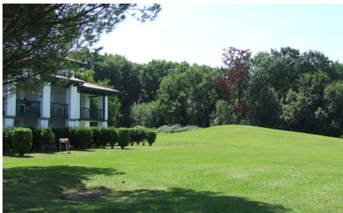
Fig. 8 - Les grandes pelouses, cernées par les boisements