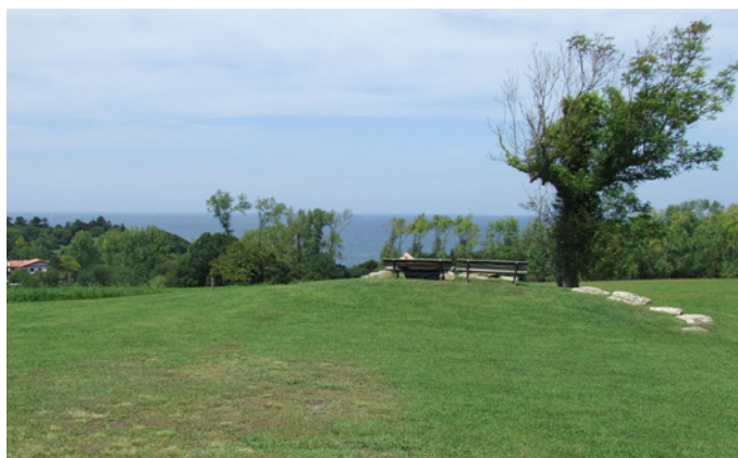
Fig. 9 - La vue vers l'océan depuis la partie Ouest