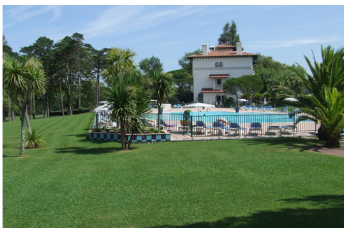
Fig. 10 - La piscine du domaine, dans un espace ouvert