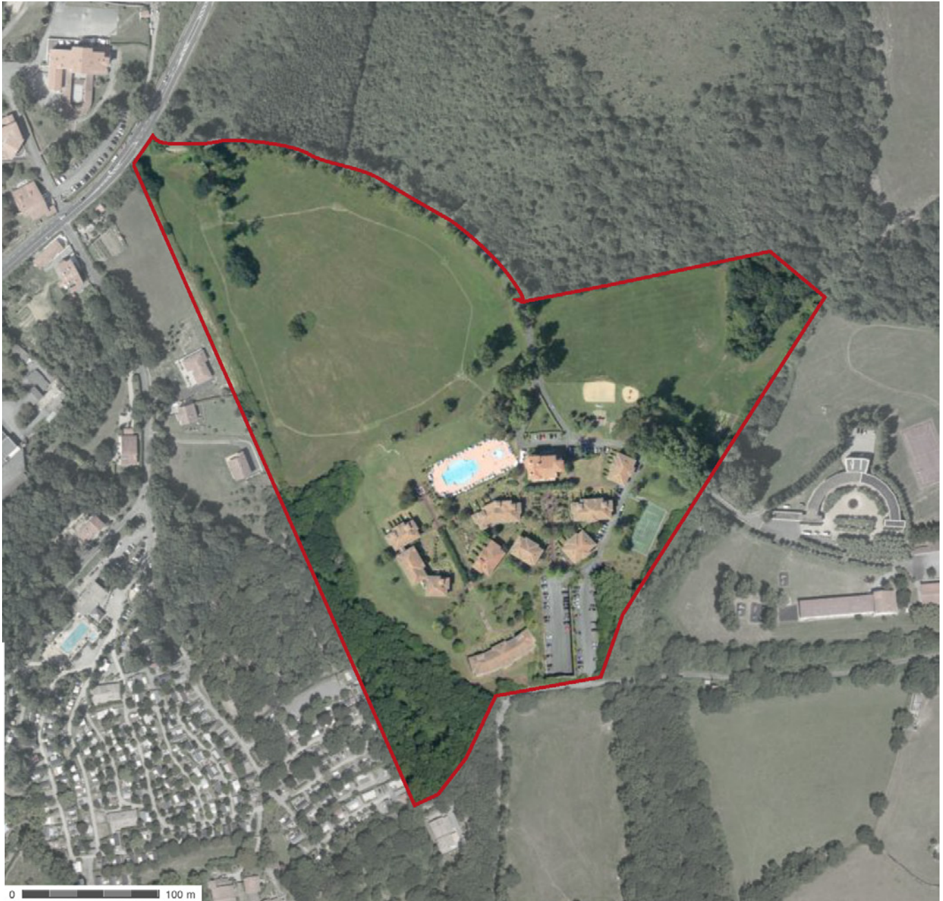
Fig. 1 - Vue aérienne du site