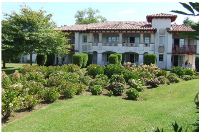
Fig. 12 - Les massifs d'hortensias