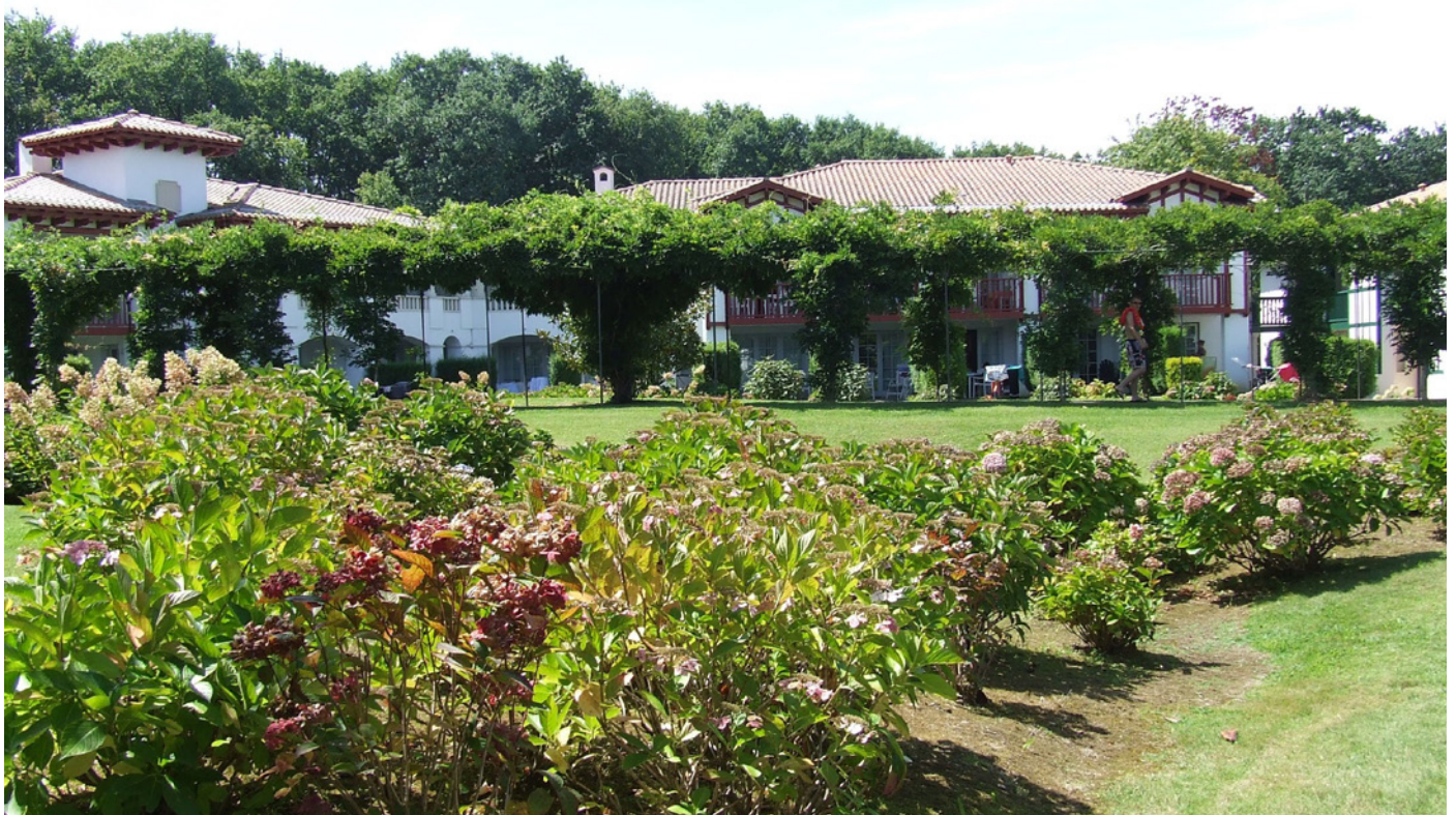
Fig. 7 - La pergola couverte de glycine traversant le domaine perpendiculairement à la pente