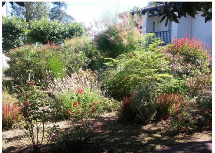
Fig. 6 - Une des ambiances végétales offertes par les jardins hétéroclites