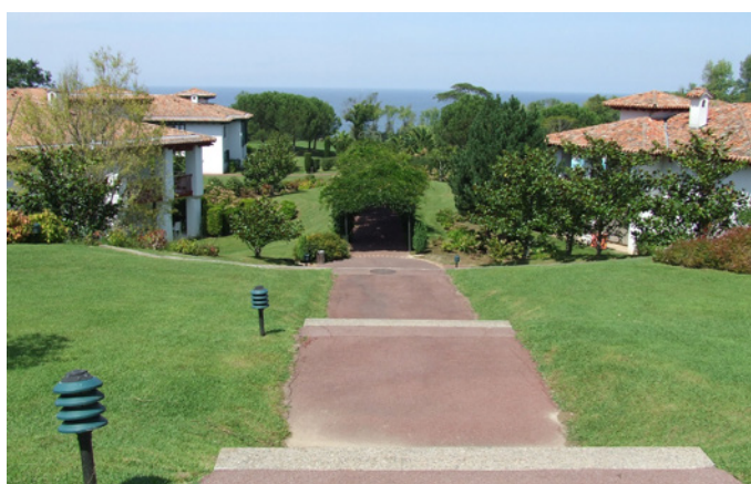
Fig. 15 - La perspective sur le domaine (l'amphithéâtre et la pergola), jusqu'à l'océan, depuis le haut du domaine