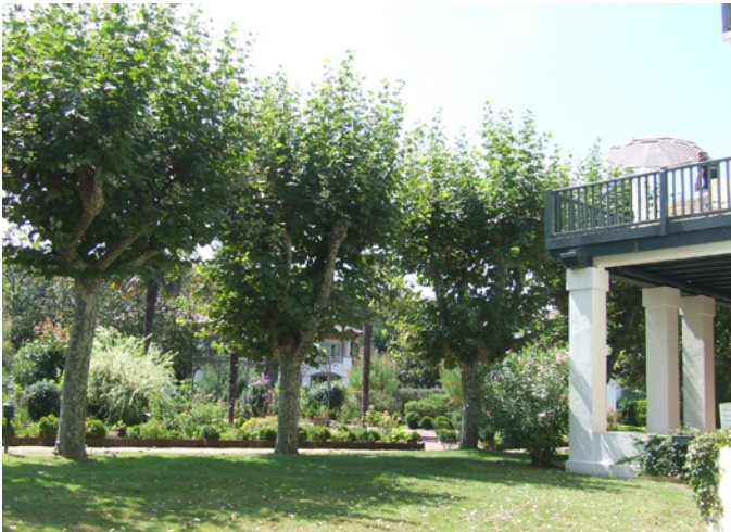
Fig. 3 - Les alignements de platanes soulignent les allées © CAUE 64