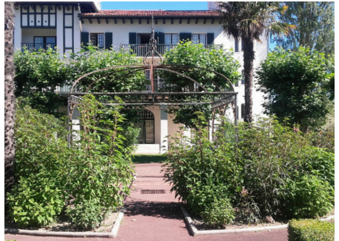
Fig. 4 - La structure métallique au centre du domaine