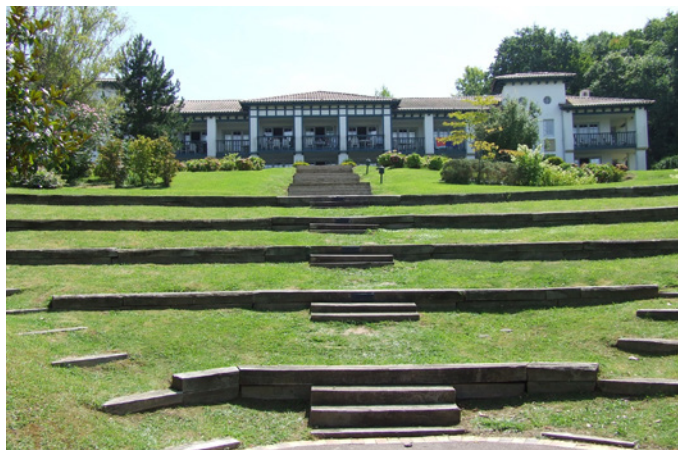
Fig. 13 - L'amphithéâtre en escalier s'inscrivant dans le relief du site