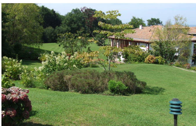
Fig. 14 - Les massifs ponctuant les pelouses en limite ouest du domaine