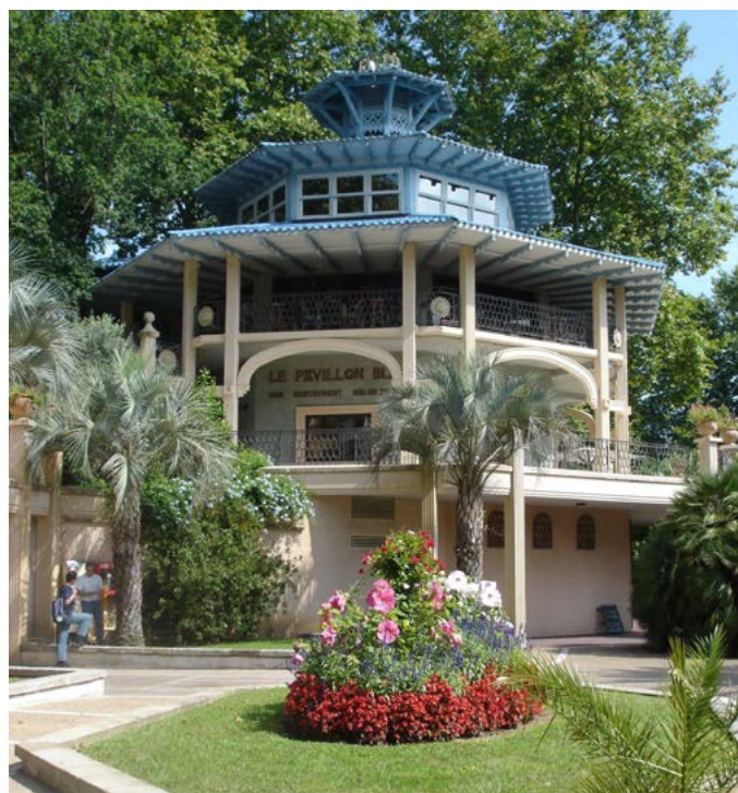
Fig. 8 - Le restaurant en rotonde évoque une folie de jardin