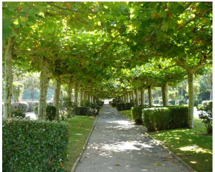
Fig. 12 - Les alignements d'arbres et de buis bordent les allées du jardin d'agrément