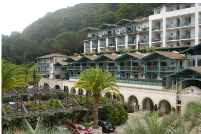
Fig. 3 - Au pied du bâtiment des thermes, les pergolas fleuries couvrent les places de stationnement