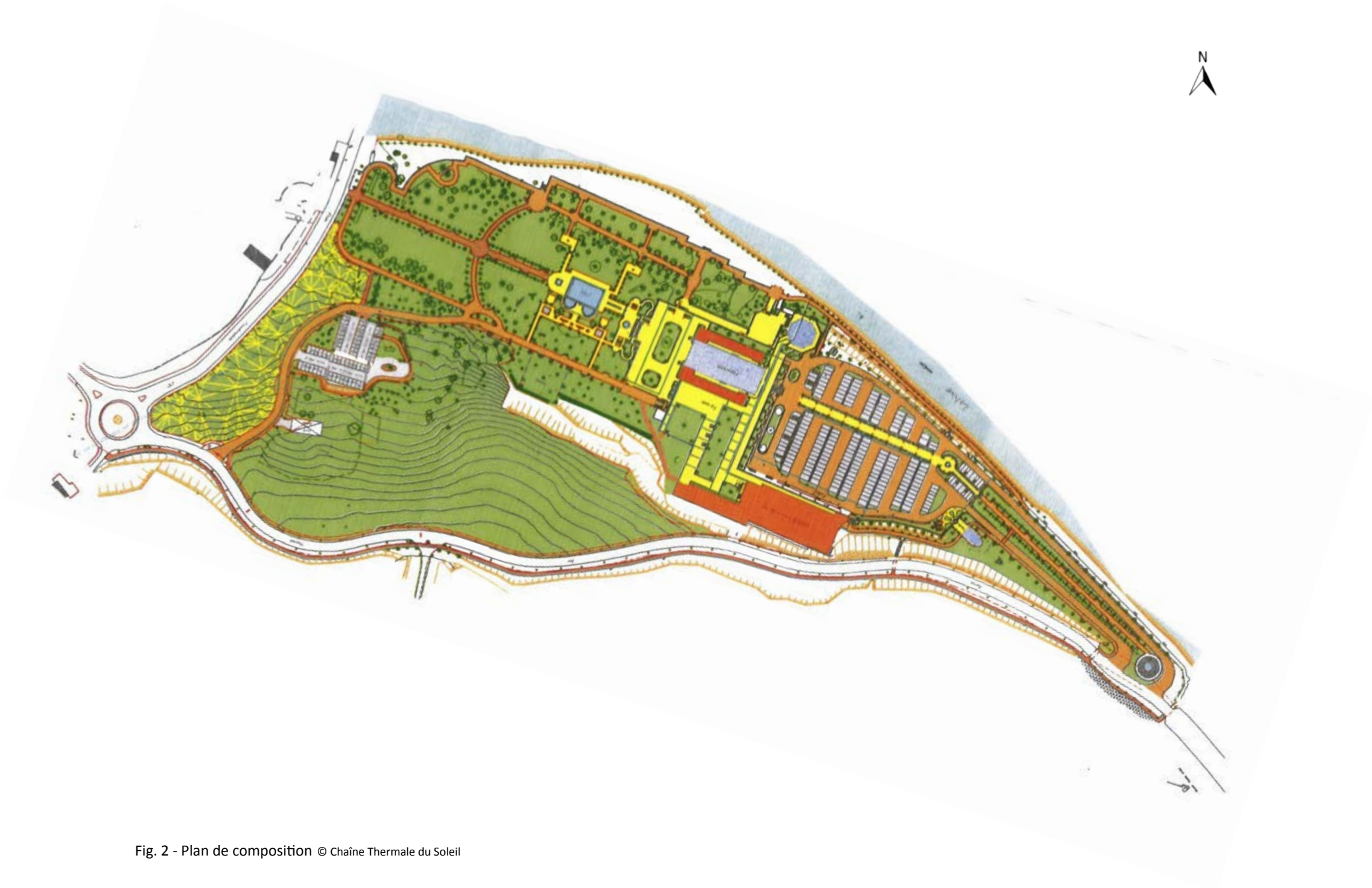
Fig. 2 - Plan de composition