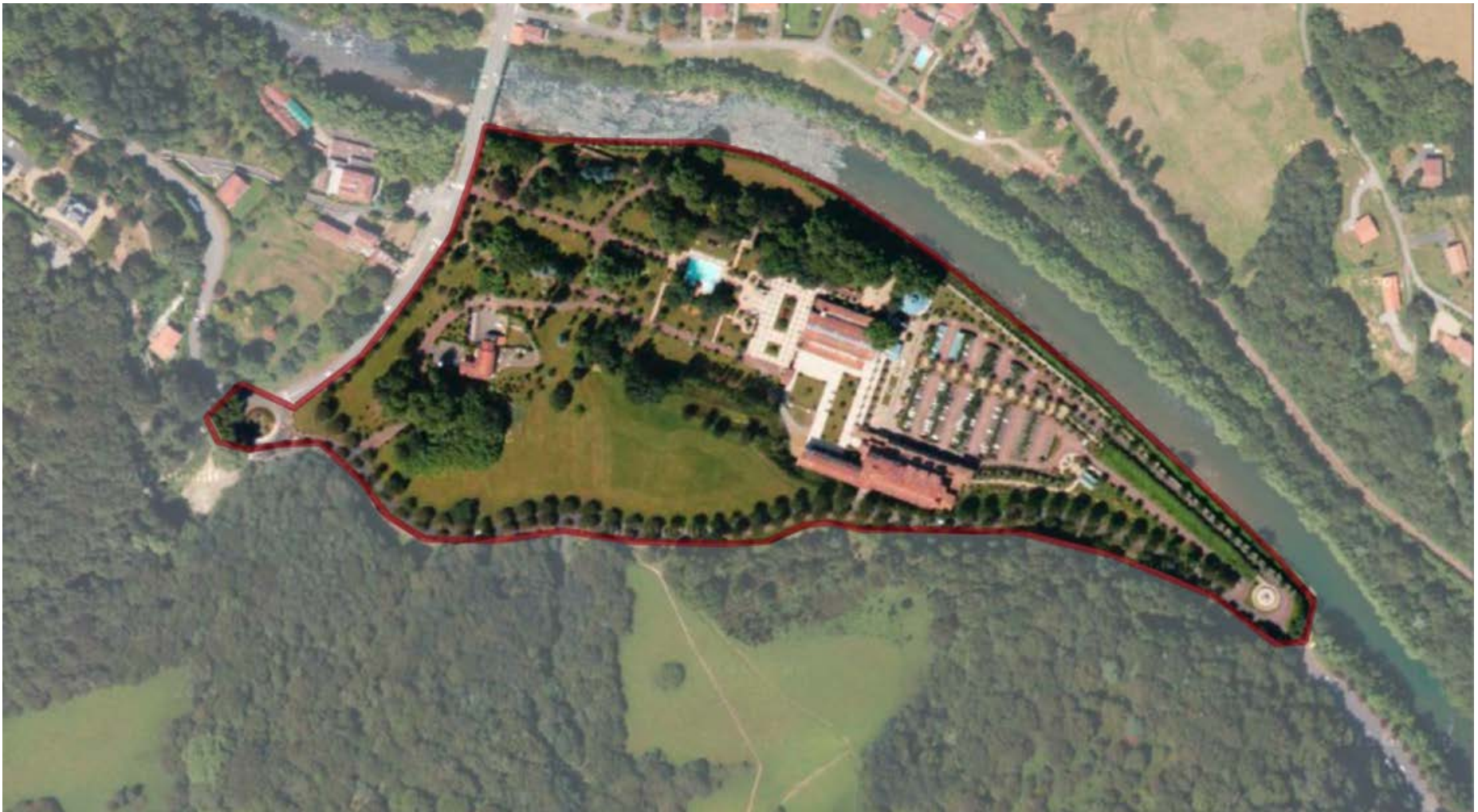
Fig. 1 - Vue aérienne du site