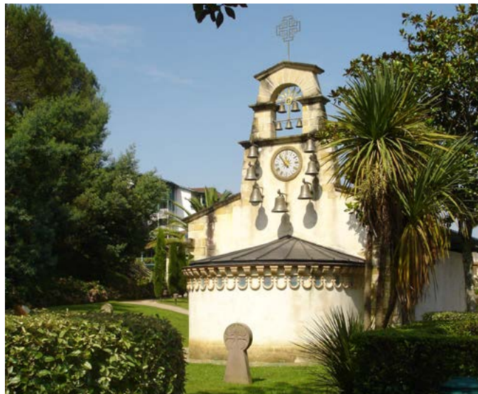
Fig. 11 - La chapelle a été reconstruite au cœur du jardin