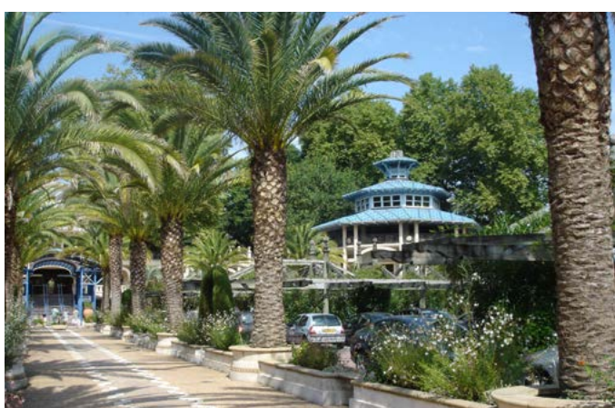
Fig. 6 - Les stationnements intégrés au jardin s'étendent régulièrement de part et d'autre de l'allée principale