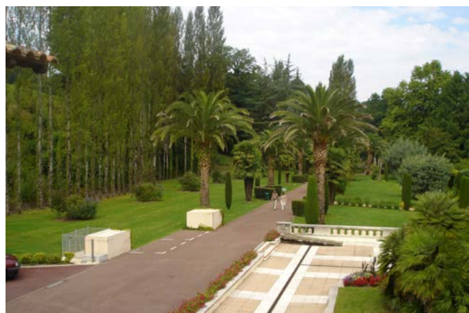
Fig. 4 - Le jardin d'agrément s'étend à l'Ouest