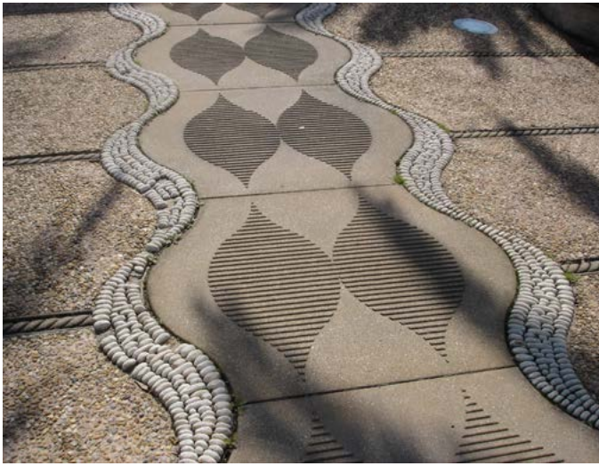
Fig. 9 - Le calepinage au sol évoque l'eau