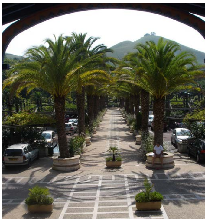
Fig. 7 - L'allée principale du jardin intégrant l'aire de stationnement, bordée de palmiers, offre une perspective vers le grand paysage