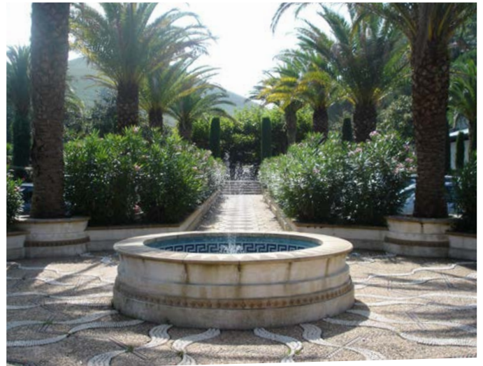
Fig. 10 - La fontaine accentue l'ambiance méditerranéenne du jardin