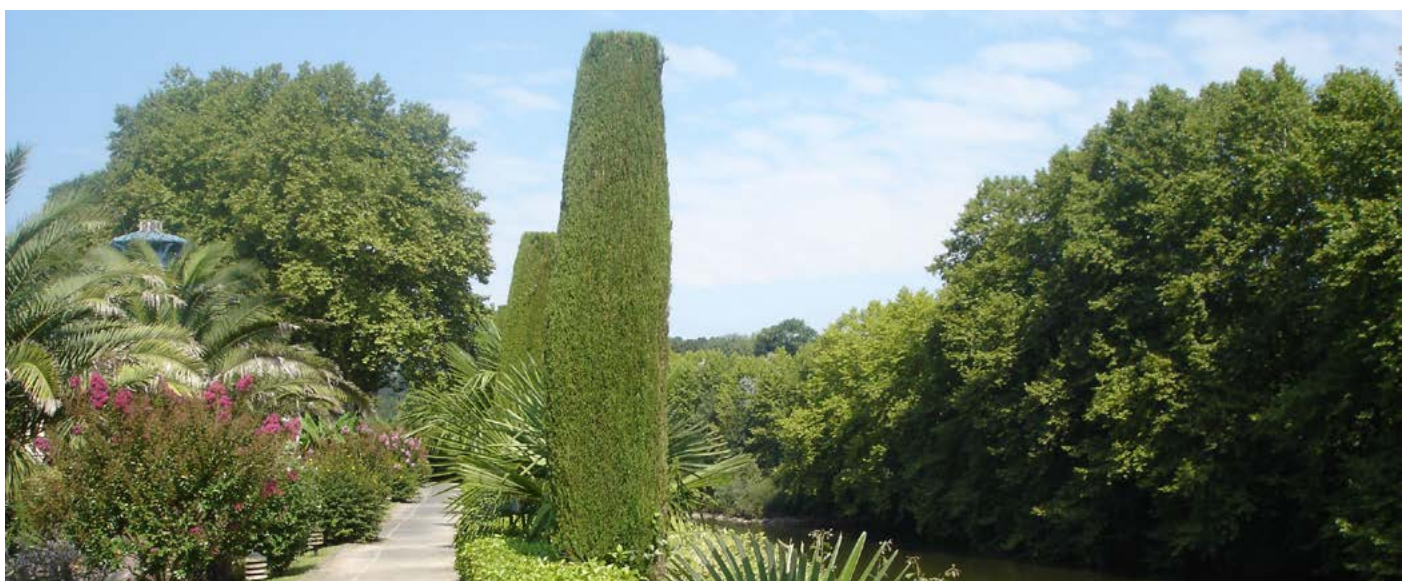
Fig. 13 - Le chemin de ceinture surplombe la Nive