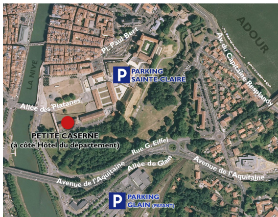
Plan d'accès Petite caserne à Bayonne