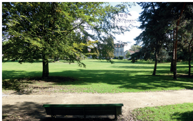
Fig. 11 - Une respiration au cœur de la ville