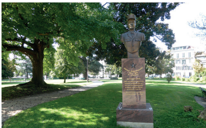
Fig. 8 - Le mémorial du Général Pommiès