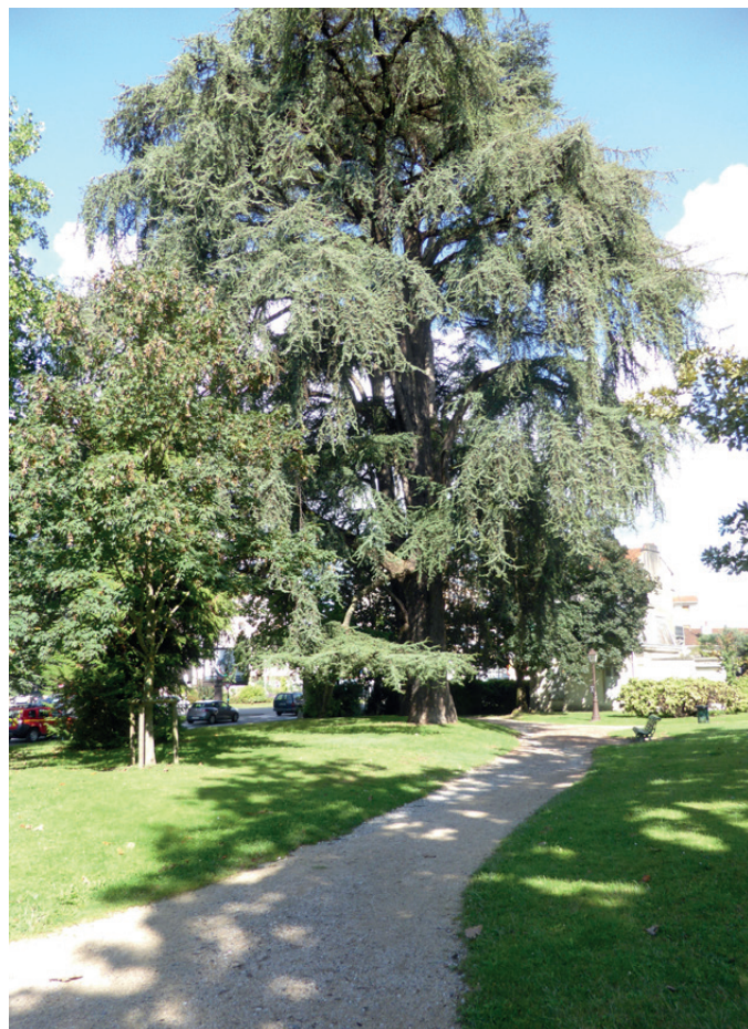
Fig. 4 - L'entrée Nord vue depuis l'intérieur du parc