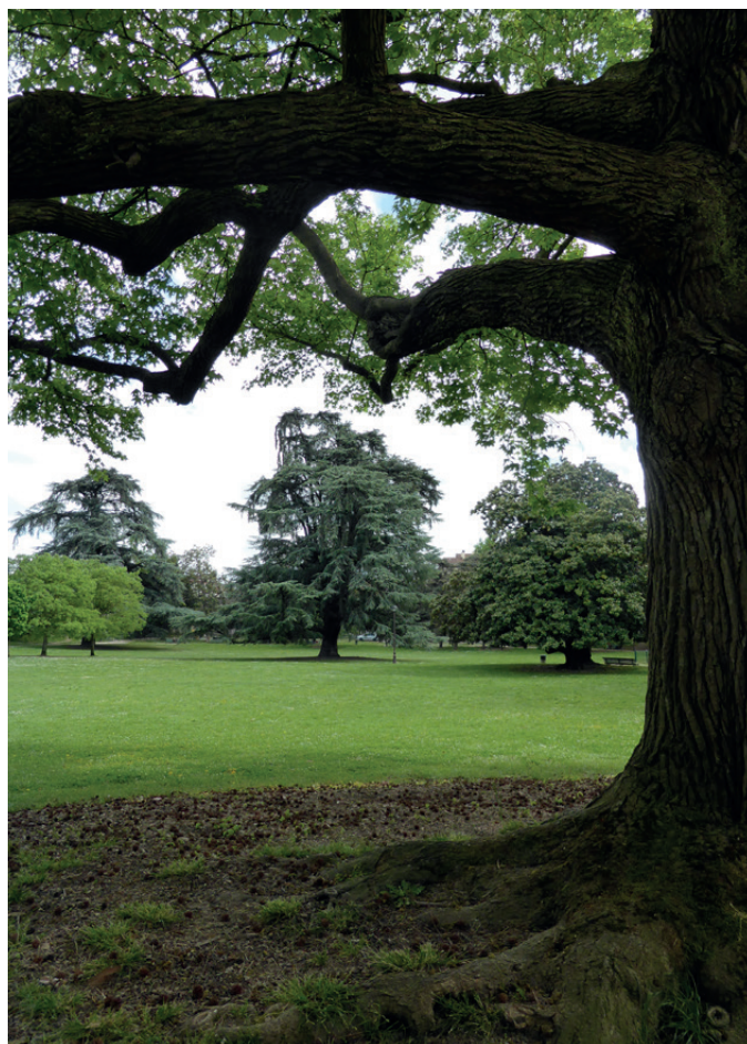
Fig. 14 - ... et des arbres remarquables soigneusement entretenus