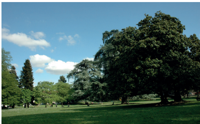
Fig. 10 - La partie Sud du parc ©CAUE 64