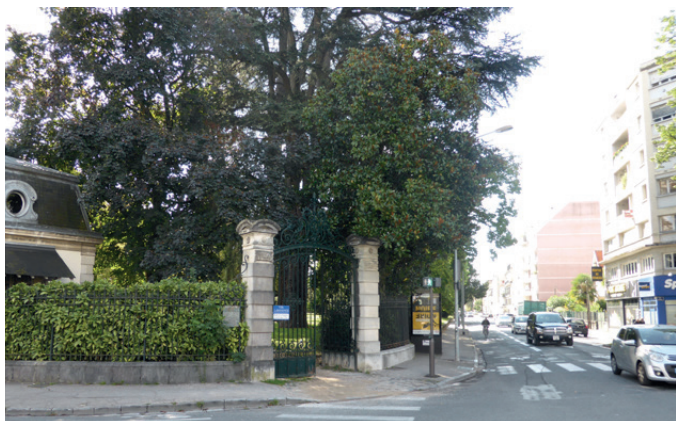
Fig. 3 - L'entrée historique Nord du parc