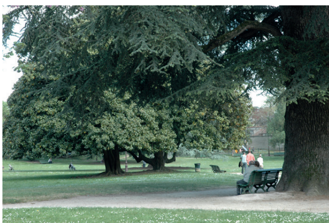
Fig. 13 - Des allées sinueuses, des aplats de verdure...