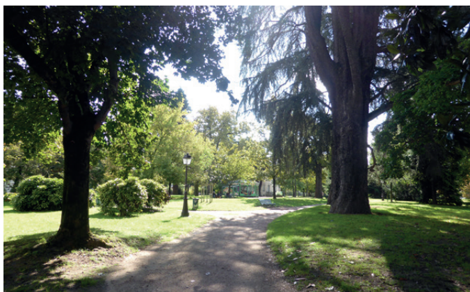
Fig. 5 - Vue depuis l'entrée Nord ©CAUE 64