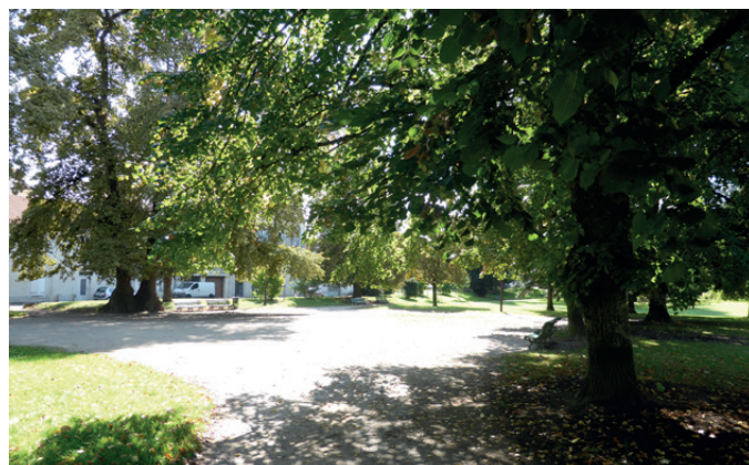
Fig. 9 - L'esplanade à l'Est du parc