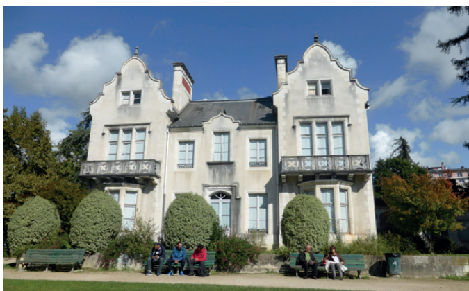
Fig. 12 - La façade Sud de la villa tournée vers les Pyrénées