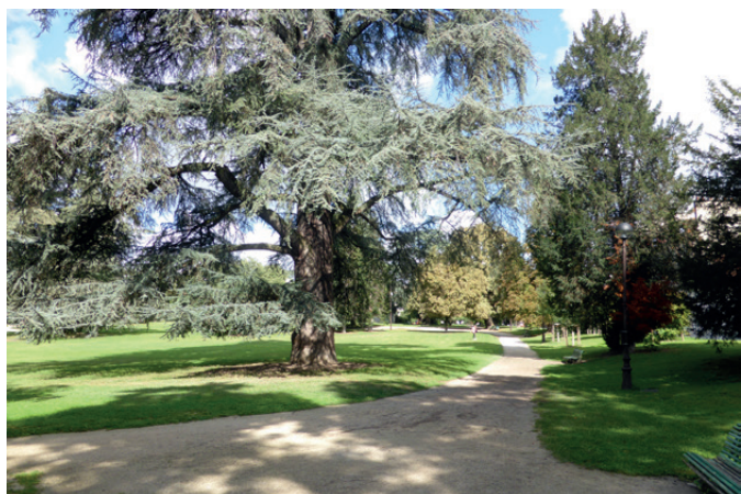
Fig. 15 - L'allée de ceinture, au Sud-Est