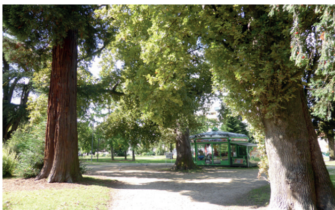
Fig. 6 - Des allées ombragées par de grands arbres