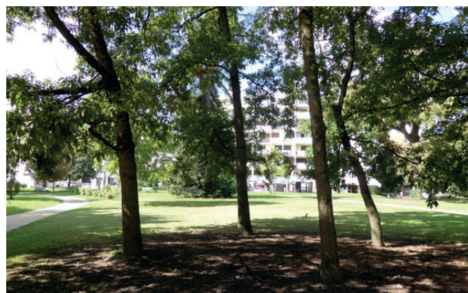
Fig. 7 - Un parc devenu urbain au fil du temps