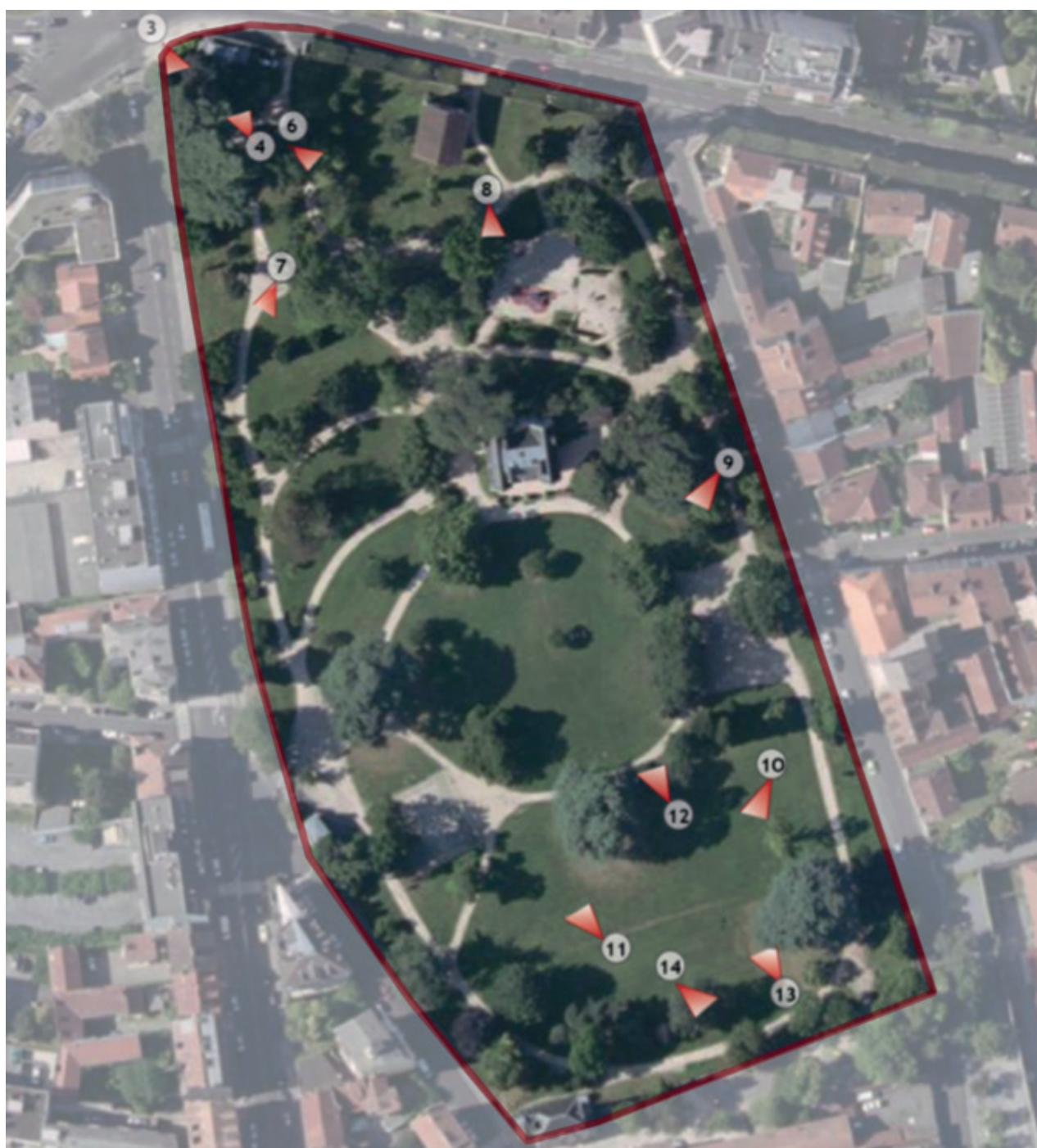
Fig. 1 - Vue aérienne du site et localisation des prises de vue