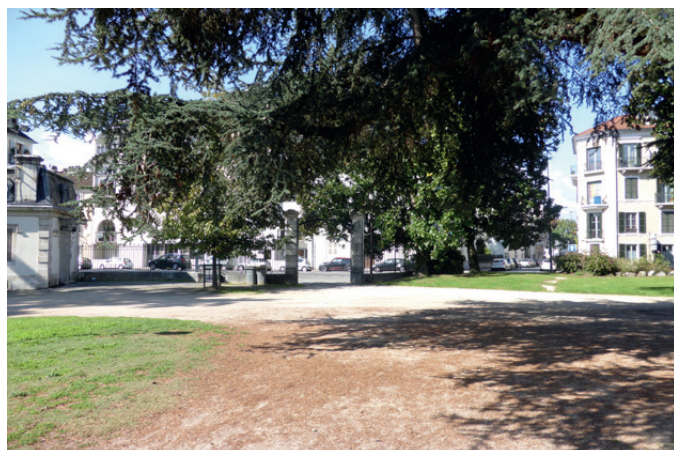
Fig. 16 - Le portail Ouest, depuis l'intérieur du parc