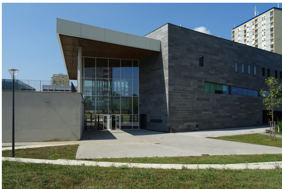
▲ La « rue intérieure » du MI[X], assurant l'interface entre le quartier de logements collectifs du Pic d'Anie et les équipements du centre