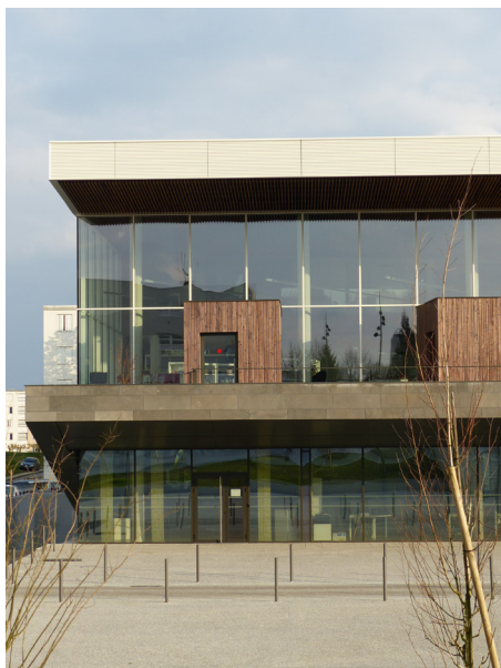
▲ Un équipement culturel largement ouvert sur son environnement pour inviter à la découverte