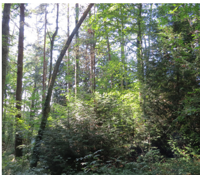
Fig. 17 – Ambiance forestière aux essences multiples dans le bois à l'Est de l'arboretum