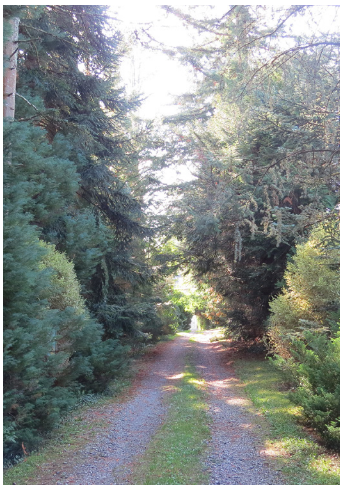
Fig. 4 - L'arrivée à la ferme, plantée d'essences variées