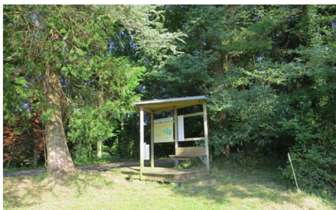
Fig. 6 - Le point de départ du circuit aménagé dans le parc