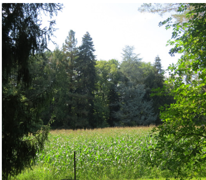
Fig. 10 - Percée visuelle sur les arbres ceinturant une parcelle cultivée en maïs