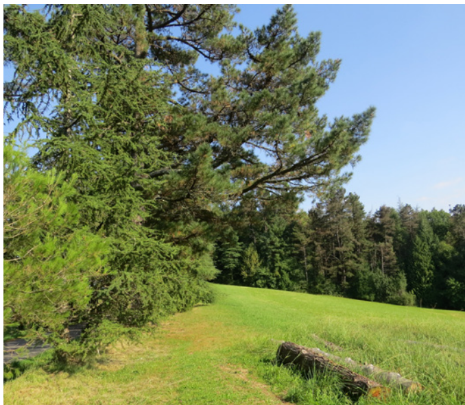
Fig. 7 - L'alignement de pins en bord de route