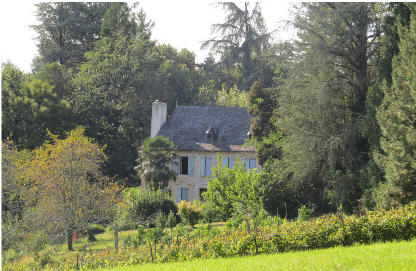
Fig. 3 – La ferme, entourée par le verger et les arbres de la collection