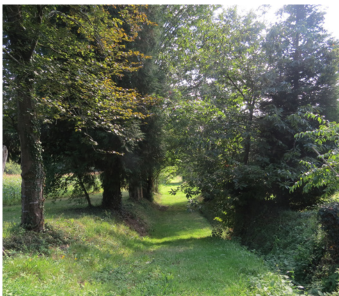
Fig. 11 - Le chemin réhabilité donnant accès au Sud du parcellaire