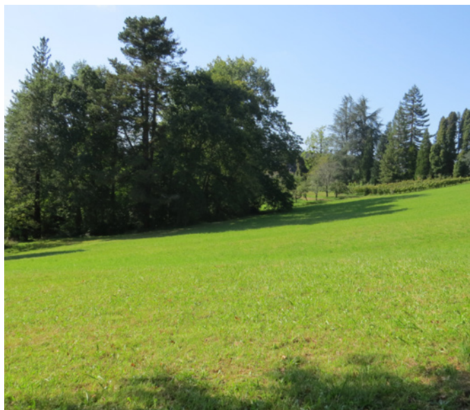
Fig. 14 – La prairie, ceinturée par les boisements