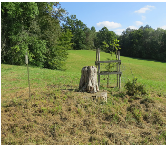
Fig. 16 – Replantation d'un arbre isolé dans la prairie