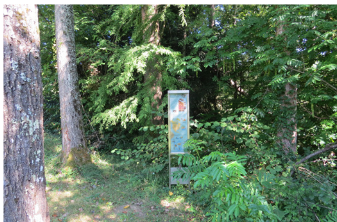
Fig. 5 - Signalétique pour la mise en valeur de l'arboretum