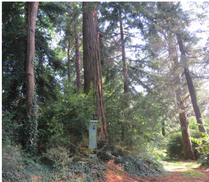
Fig. 8 - Les boisements en peuplement derrière la ferme