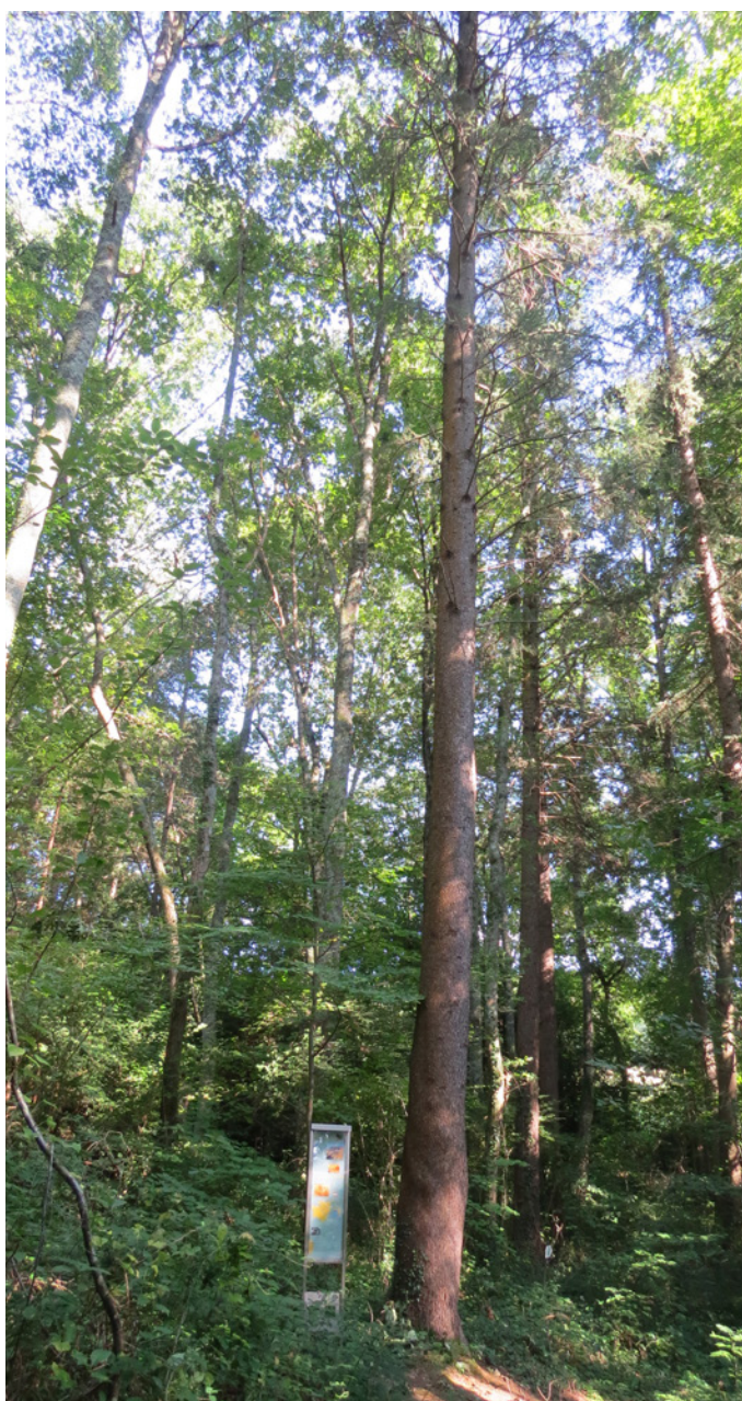
Fig. 15 – Le cèdre du Liban dans le bois