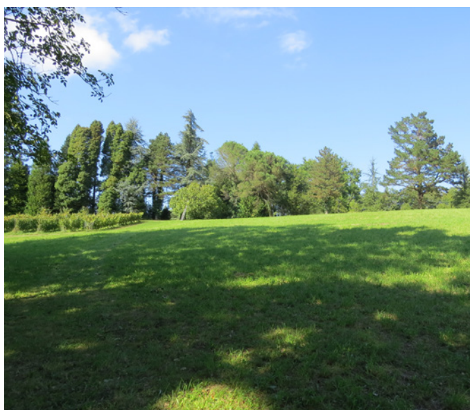
Fig. 12 - Vue sur l'alignement et la vigne en haut de crête