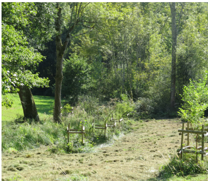
Fig. 13 – Plantations de peupliers et d'un bosquet d'ornement