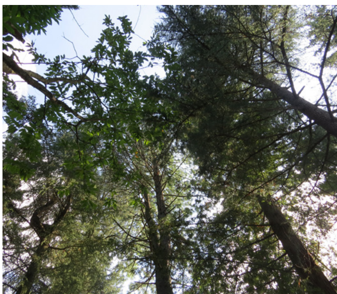
Fig. 9 - La canopée des arbres aux essences variées