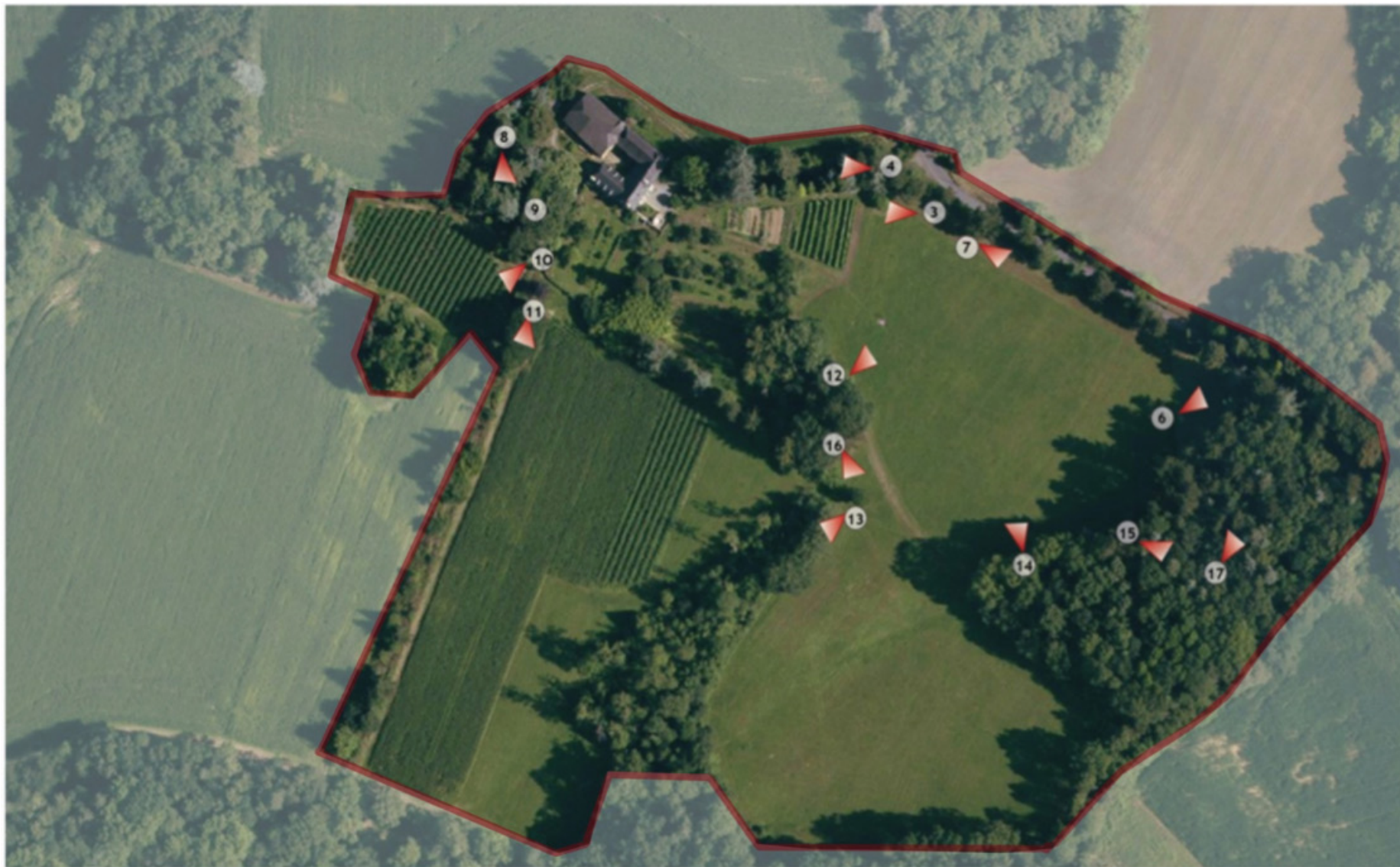
Fig. 1 - Vue aérienne du site et localisation des prises de vue