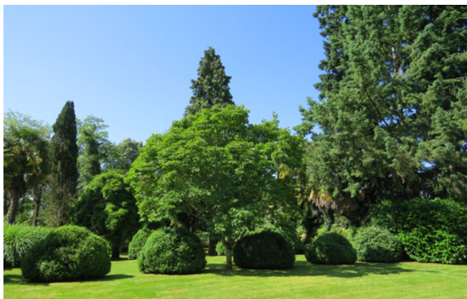
Fig. 9 - Topiaires et compositions régulières du jardin à la française