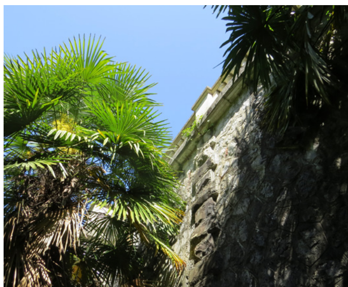
Fig. 17 - Le mur de soutènement