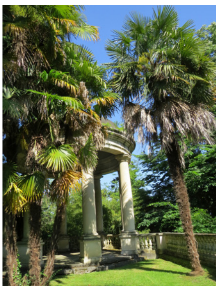
Fig. 11 - La rotonde belvédère