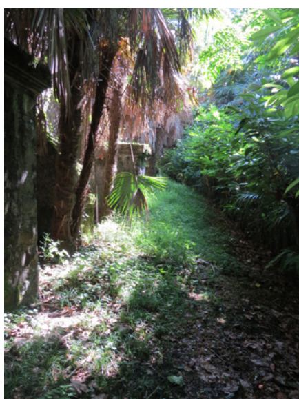
Fig. 23 - Le sentier en contrebas du mur de soutènement