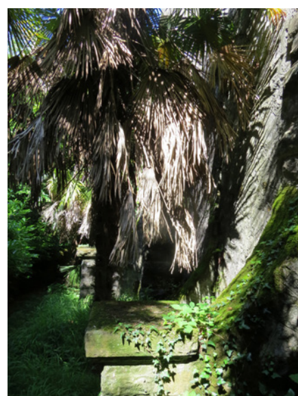
Fig. 24 - Le sentier en contrebas du mur de soutènement