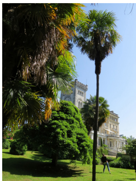
Fig. 12 - Le palais vu depuis la rotonde