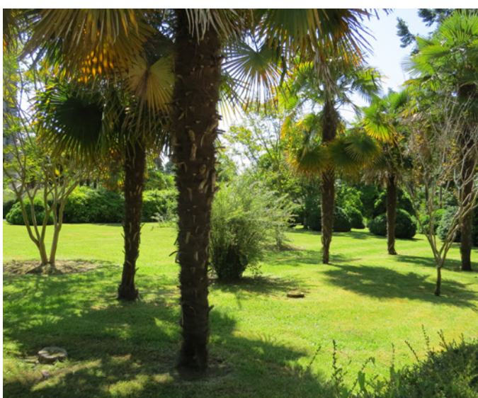
Fig. 21 – La palmeraie