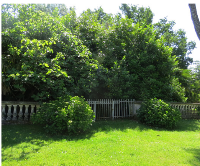
Fig. 20 – L'accès aux escaliers Est