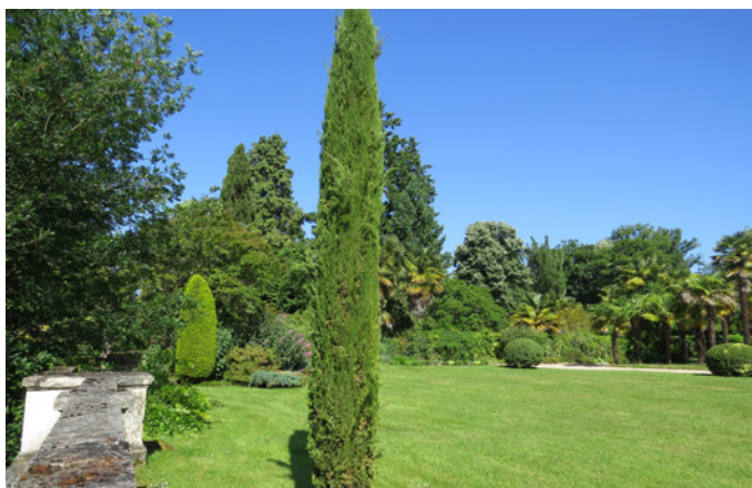
Fig. 7 - Arbres et massifs composés