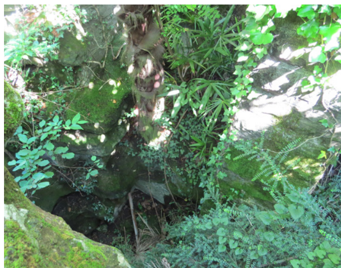
Fig. 15 - La rocaille et la source depuis le pont