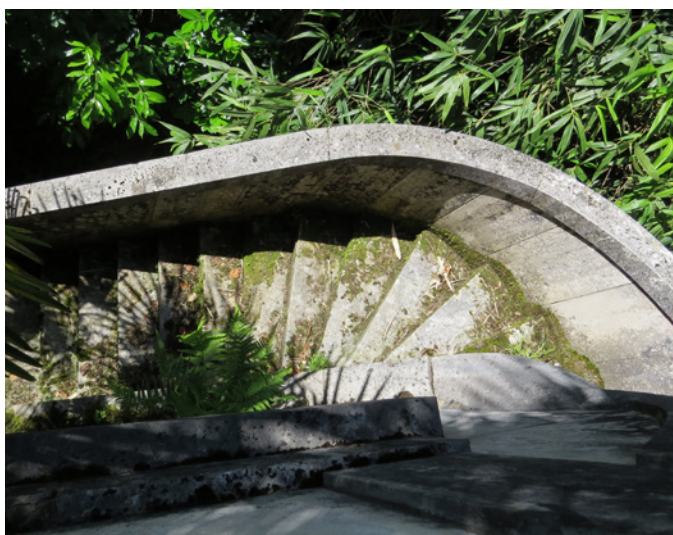
Fig. 14 - L'escalier près de la rotonde