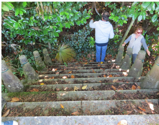
Fig. 19 – Les escaliers droits côté Est