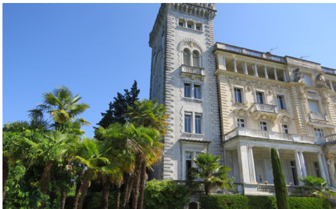
Fig. 3 - L'angle Sud-Ouest du palais et sa tour