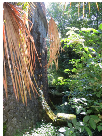
Fig.13 - La base de la rotonde