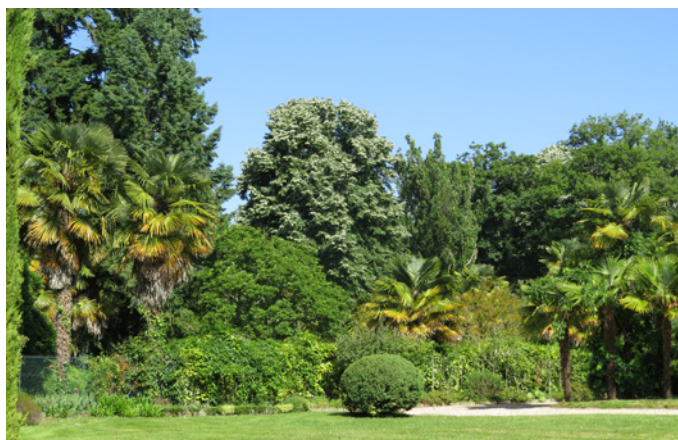
Fig. 8 - Les palmiers très présents