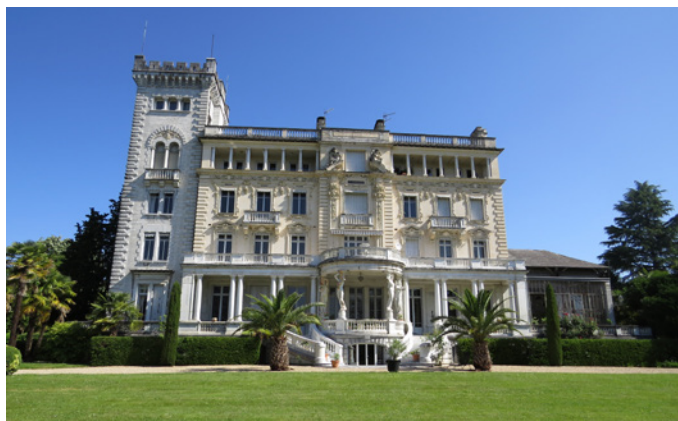
Fig. 4 - La façade Sud du palais et la serre à l'Est