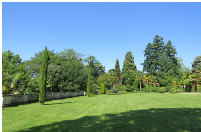
Fig. 6 - Le jardin d'ambiance méditerranéenne