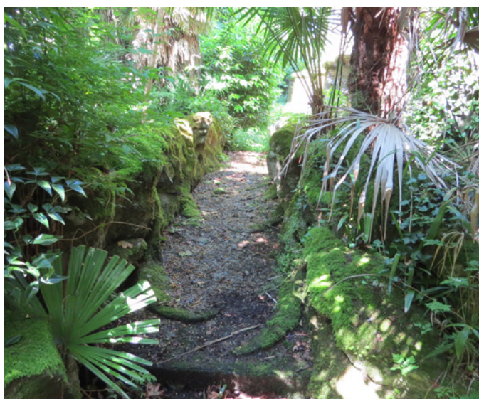
Fig. 16 - Le pont