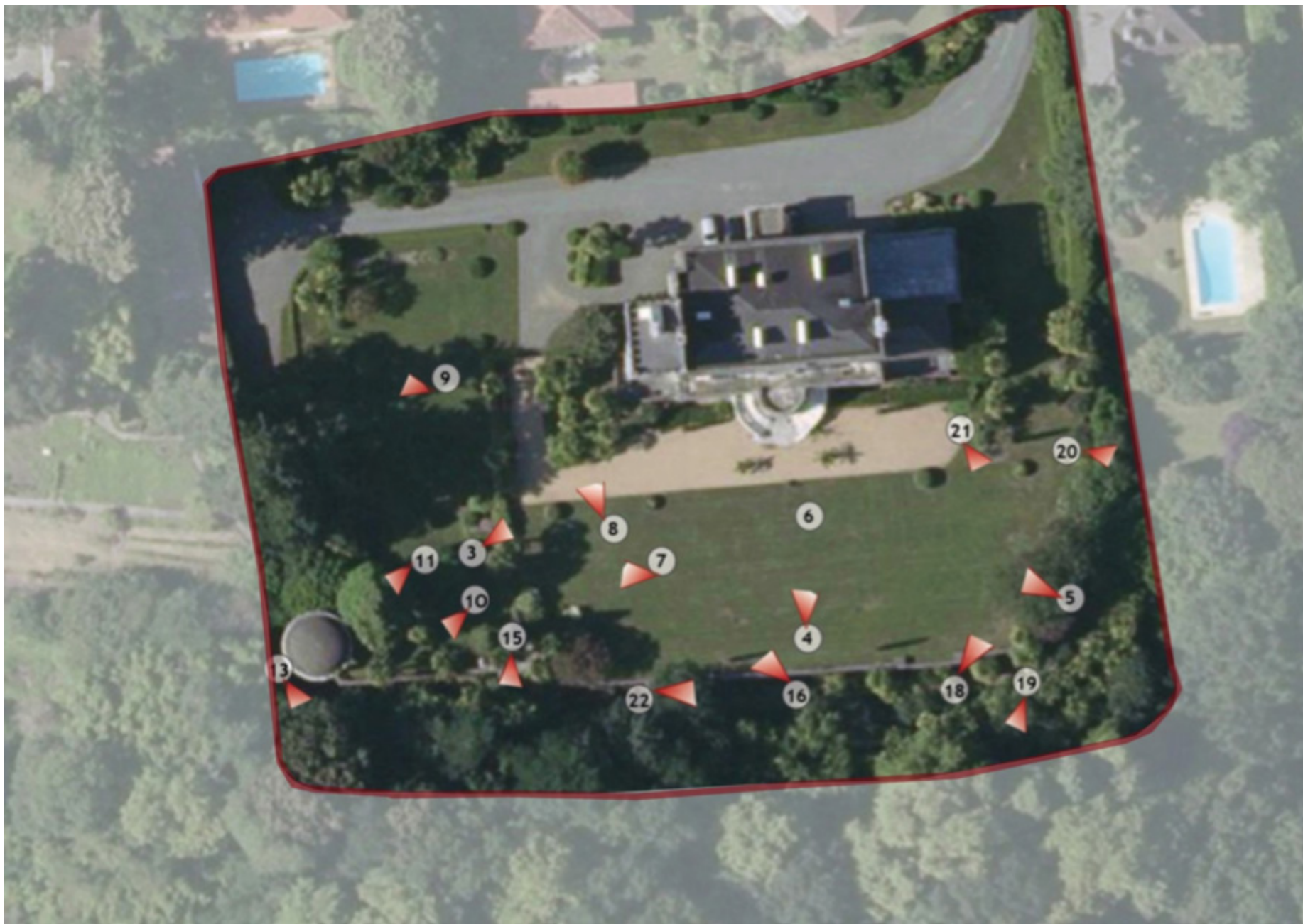
Fig. 1 - Vue aérienne du palais et des jardins, et localisation des prises de vue