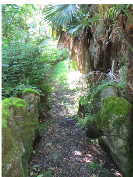
Fig. 22 - Le sentier en contrebas du mur de soutènement