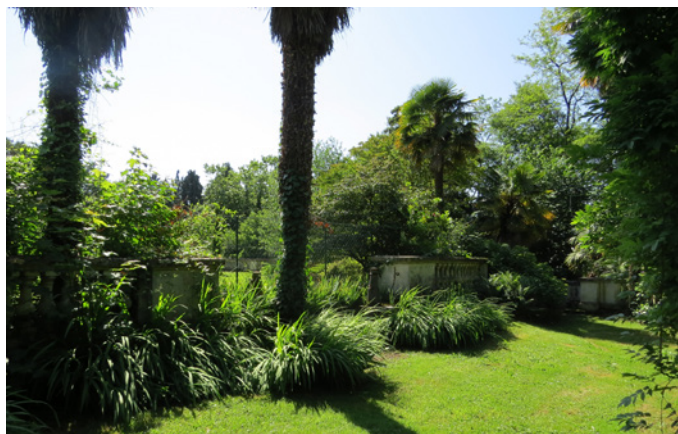
Fig. 10 - La balustrade près de la rotonde