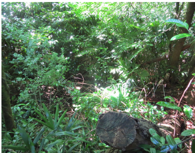
Fig. 18 – L'enrichissement du bois et des sentiers secondaires