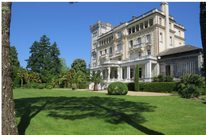
Fig. 5 - La terrasse supérieure