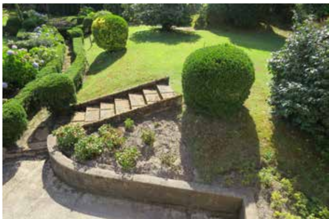
Fig. 8 - Un escalier dans la pente