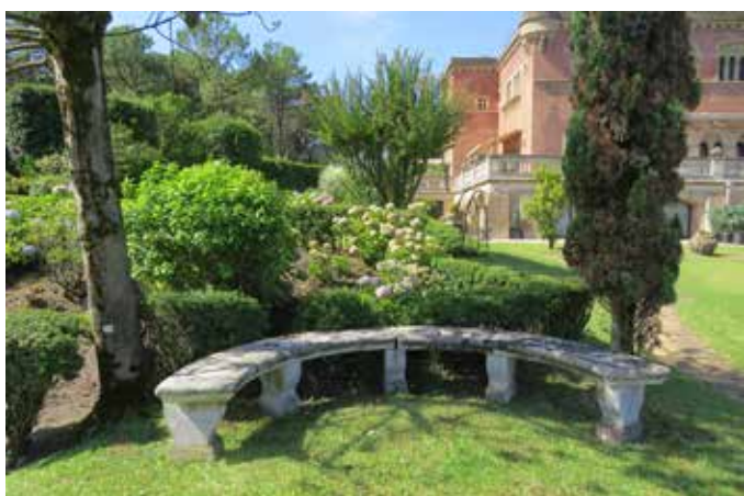
Fig. 14 - Un banc dans la verdure face au golf