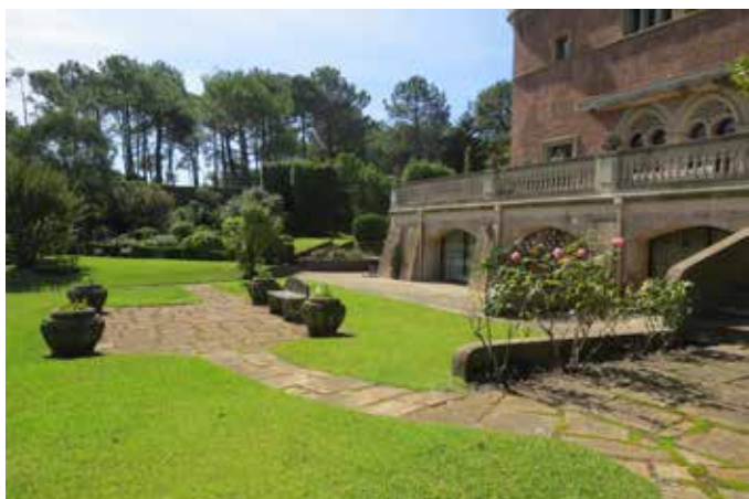
Fig. 12 - Le belvédère devant la façade principale de la villa