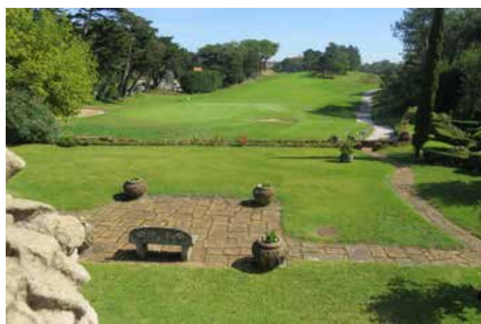
Fig. 6 - La mise en scène du golf depuis la terrasse