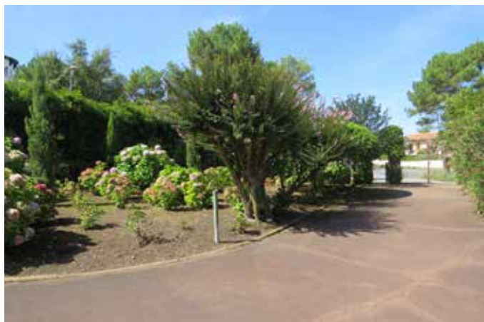
Fig. 9 - L'entrée côté cour