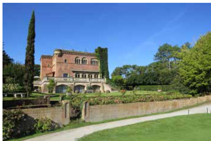
Fig. 4 - La façade Nord-Est de la villa et les jardins surplombant le golf