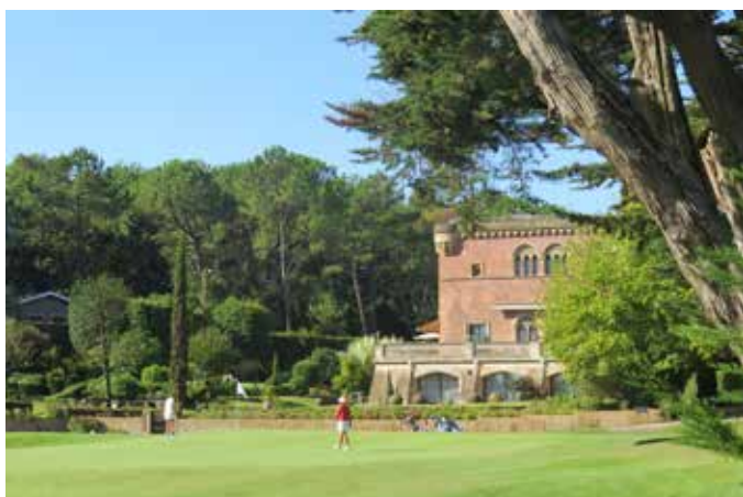
Fig. 3 - La villa depuis le golf de Chiberta