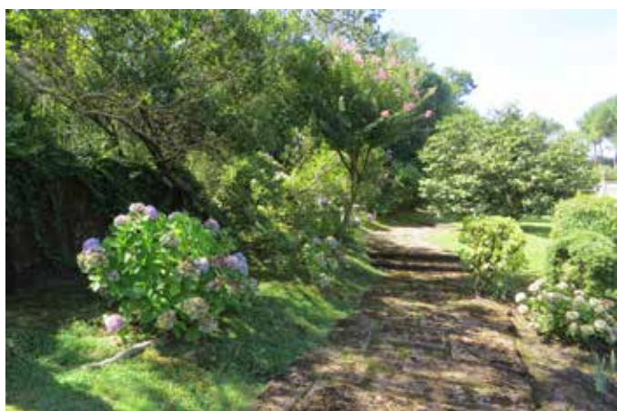
Fig. 15 - Le cheminement latéral bordé d'hortensias et d'arbustes méditerranéens