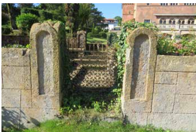
Fig. 5 - Détail de l'entrée Nord-Est des jardins