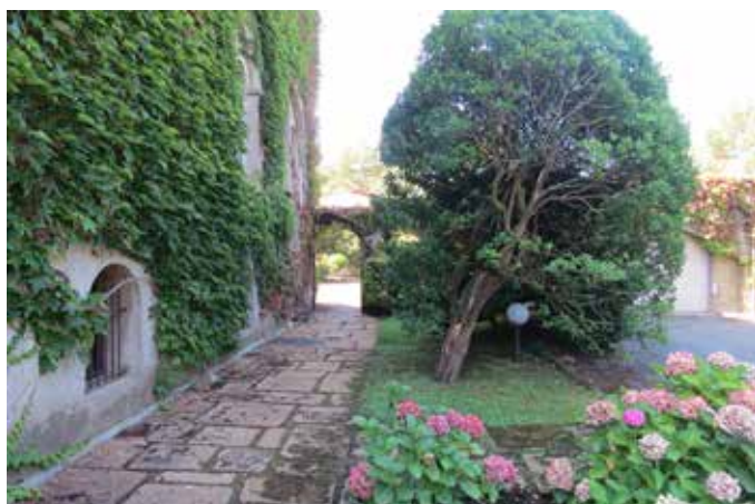
Fig. 11 - Le dallage d'époque au Nord-Ouest de la villa