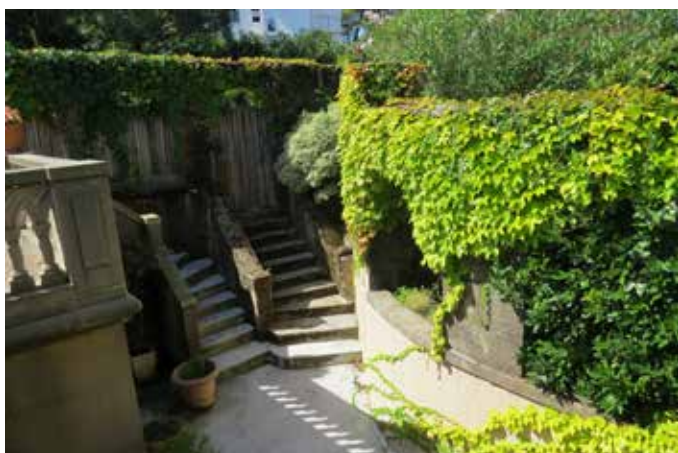
Fig. 10 - Les accès secondaires à la villa entre jardin et cour