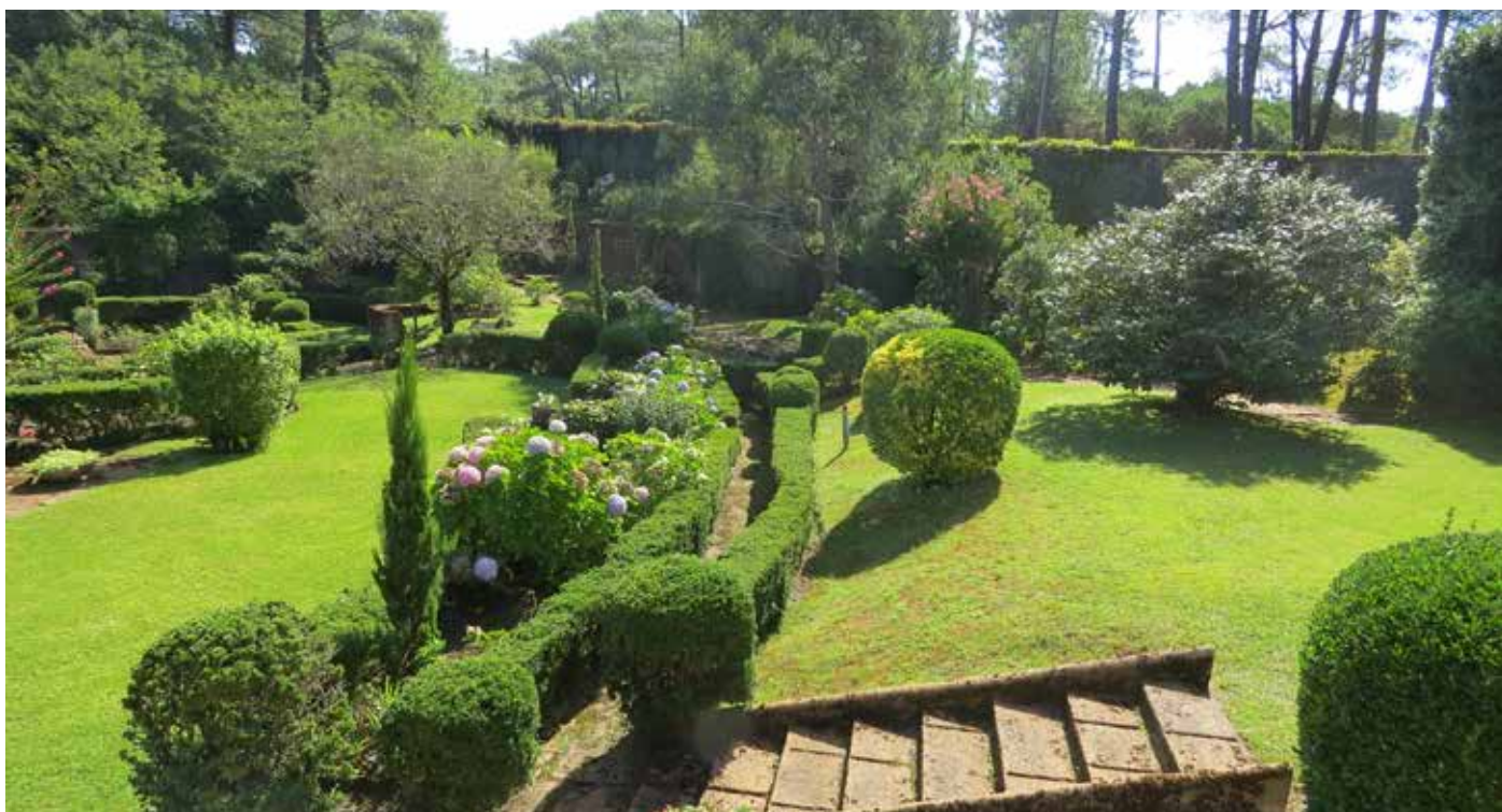
Fig. 7 - Le traitement de la transition entre terrasses inférieure et supérieure