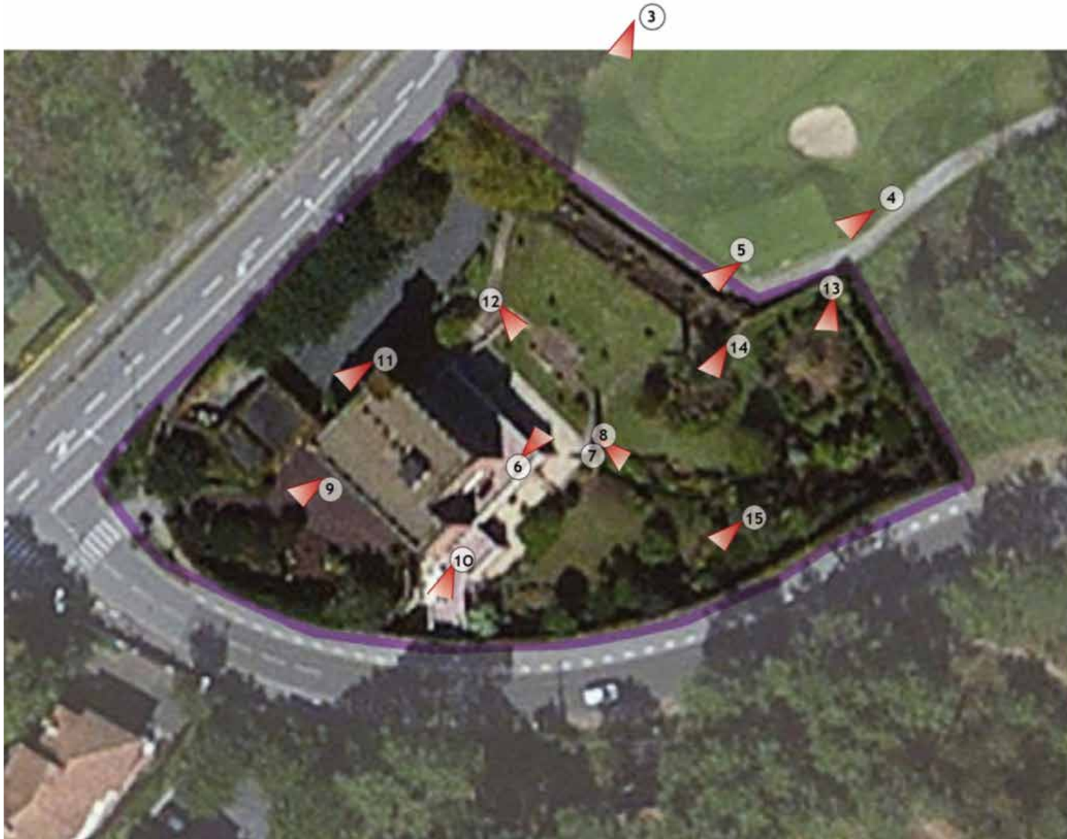
Fig. 1 - Vue aérienne du site