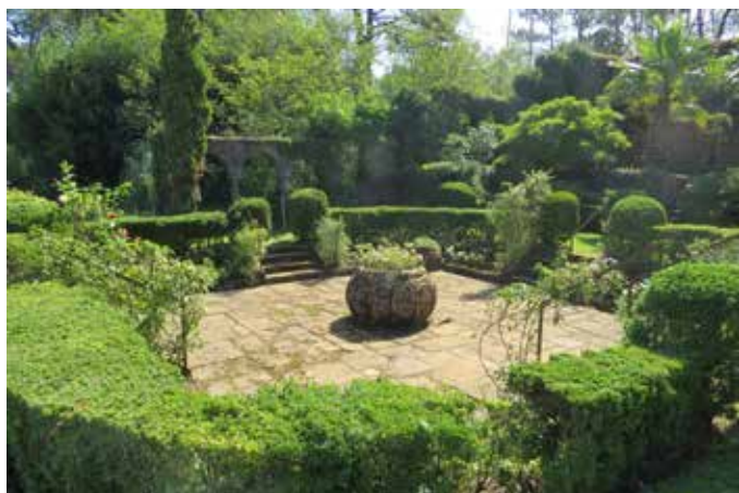
Fig. 13 - La roseraie en creux