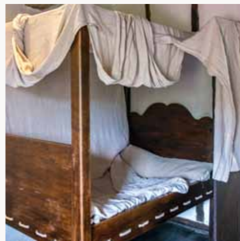
La cuisine et l'une des quatre chambres d'Ortillopitz. Sous la fenêtre de la cuisine, la dalle en pierre avec évacuation servait de douche pour toute la famille. Quant aux lits en hauteur, ils protégeaient de l'humidité et du froid.

on aperçoit le pic d'Anie et le pic d'Orhy. S'effacent, au fur et à mesure de notre avancée vers les montagnes, les maisons rouge et blanc pour laisser place à des maisons plus massives, avec de petites ouvertures permettant de lutter plus efficacement contre le froid. La tuile est remplacée par l'ardoise et l'inclinaison des toits s'accroît afin d'éviter que la neige s'y accumule. "Avant l'ardoise, les toits étaient le plus souvent couverts de bardeaux de bois (de châtaignier, en principe), voire, pour les plus pauvres, de chaume. Il subsiste en campagne quelques rares toits en bardeaux sur des granges oubliées" , précise Christian Bouché. S'il existe une règle pour la maison souletine, c'est celle de l'adaptation au terrain. "Ici, les paysans regardaient la nature et s'en inspirait avec bon sens" raconte Jean-Jacques Etcheberri, entrepreneur d'Ordiarp très investi dans la vie locale qui nous fait visiter les lieux. "La maison souletine, c'est la maison pyrénéenne, très simple. Cinq fenêtres, une façade en pierre, une porte d'entrée et une porte charretière pour la partie agricole.