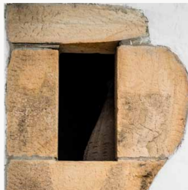
Maison traditionnelle bas-navarraise à Saint-Étienne-de-Baïgorry, derrière le pont romain qui enjambe la Nive des Aldudes. Ci-dessus , détail de grès.

Labourdine, bas-navarraise ou souletine, partons à la découverte de l'architecture des maisons basques, et plus particulièrement des fermes, dont le point commun est d'abriter entre leurs murs épais les familles autant que leurs histoires.