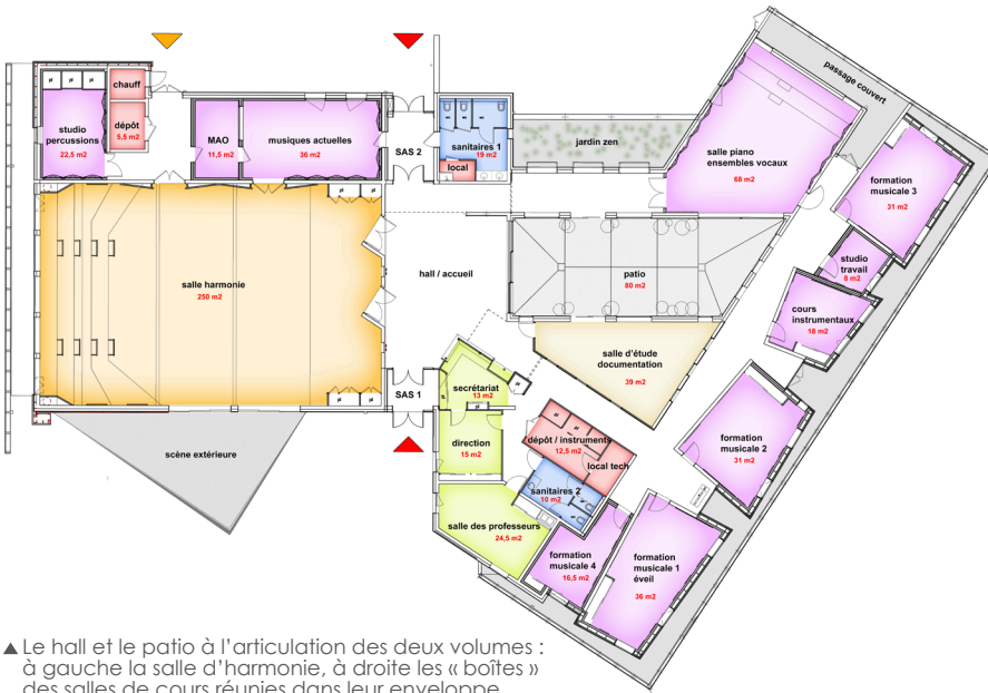
▲ Le hall et le patio à l'articulation des deux volumes : à gauche la salle d'harmonie, à droite les « boîtes » des salles de cours réunies dans leur enveloppe