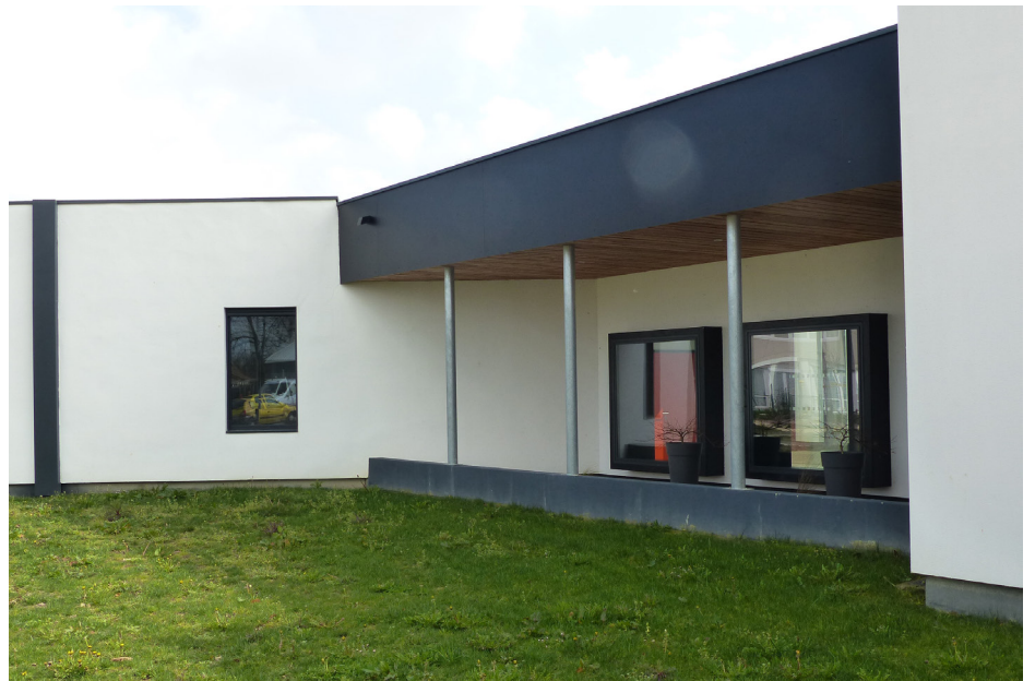
▲ Des lignes noires sur fond blanc comme évocation de la partition musicale