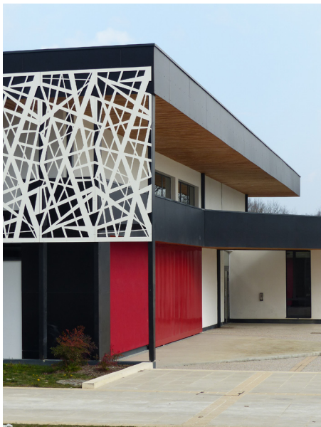
▲ Une architecture contemporaine aux lignes franches, que tempère une résille plus informelle