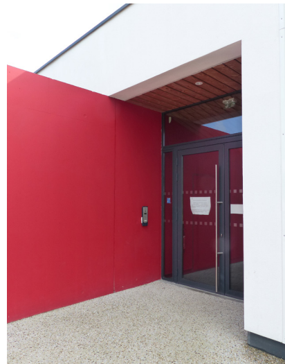
▲ Du noir et blanc, et le rouge réservé aux éléments signal