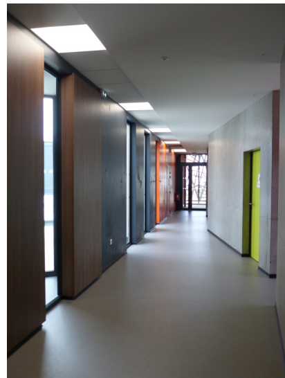
Circulation autour des « boîtes » indépendantes ▲