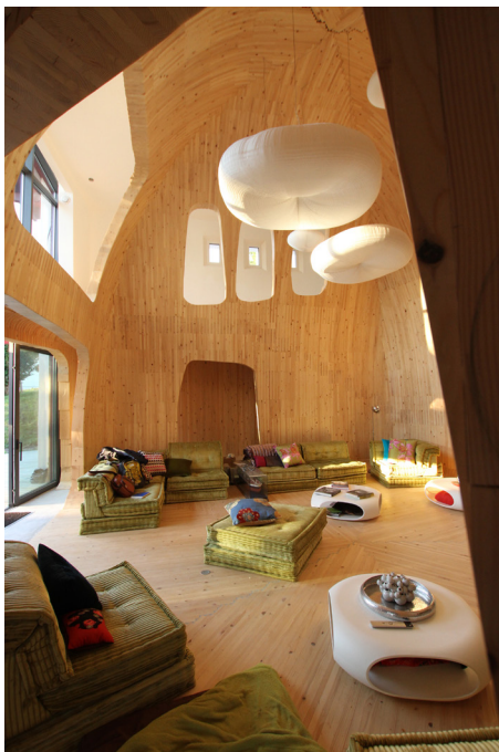
▲ Le coeur de la maison : un bel espace en double hauteur tapissé de bois.