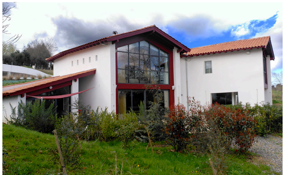
▲ Une enveloppe bâtie extérieure qui respecte les fondamentaux de l'architecture basque, malgré la complexité de l'agencement des volumes