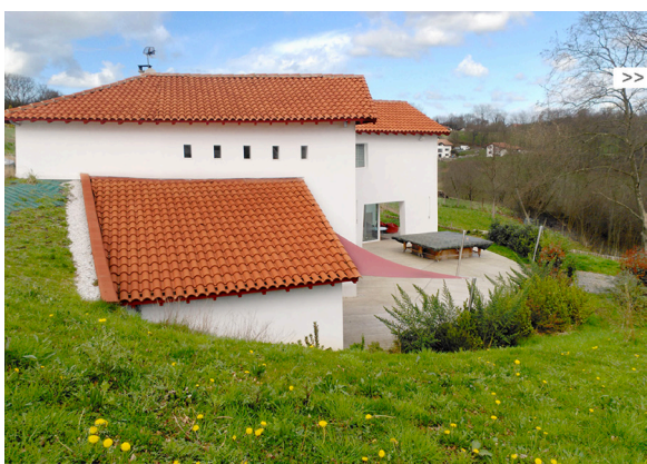
▲ Une maison intégrée dans la pente.