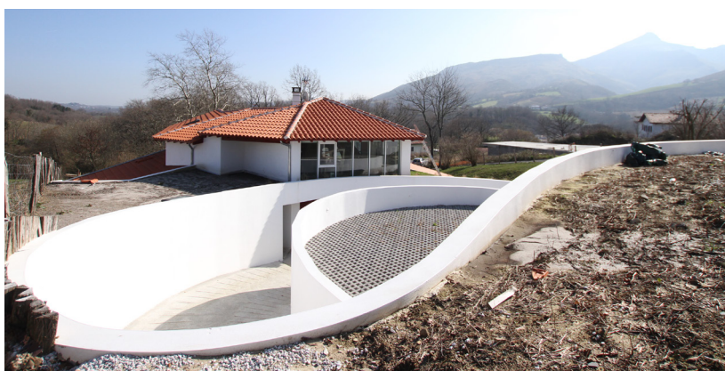
▲ En amont, l'accès et l'aire de stationnement, comme un ruban blanc incisé dans la colline.