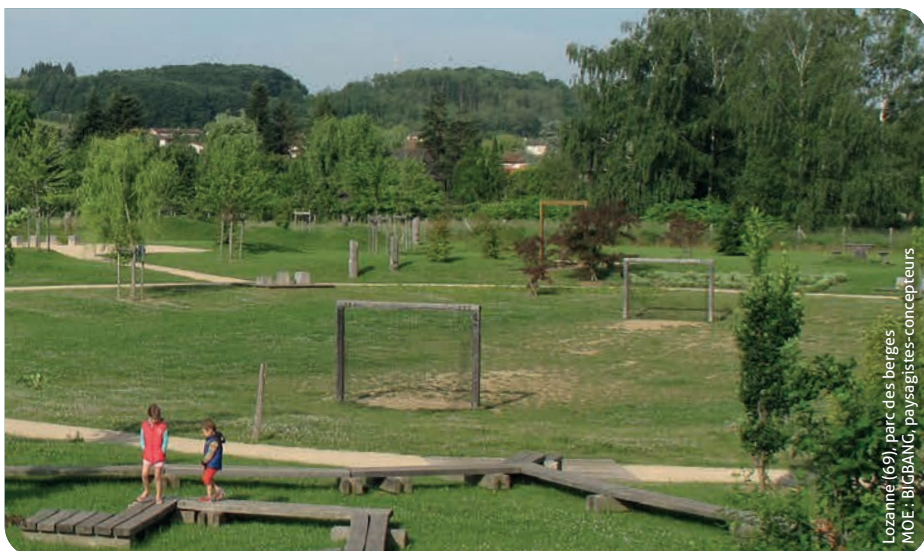
Lozanne (69), parc des berges MOE : BIGBANG, paysagistes-concepteurs