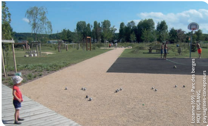
Lozanne (69) - Parc des berges MOE : BIGBANG, paysagistes-concepteurs