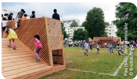
Pau (64) - Jardin invisible