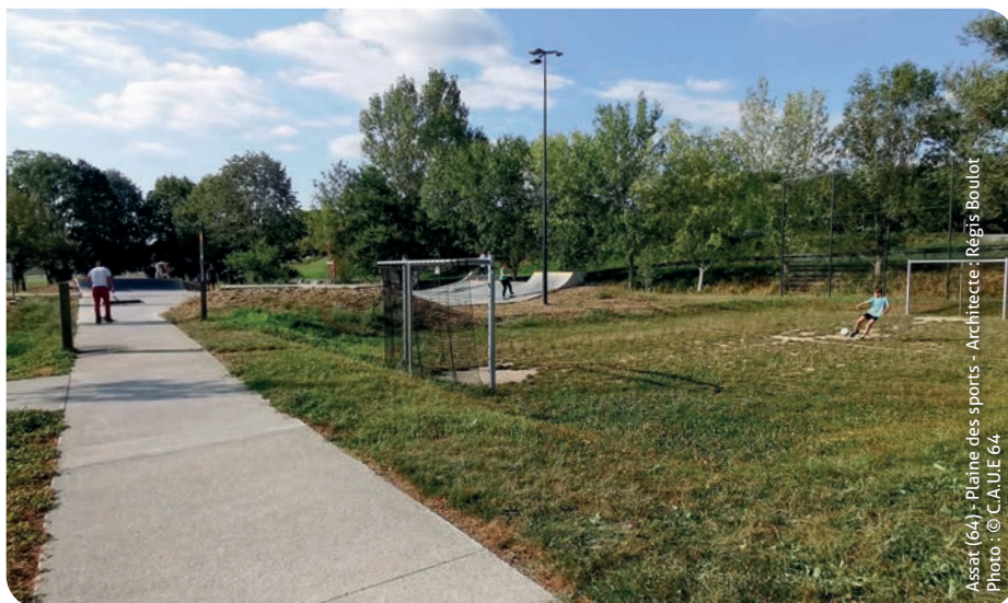
Assat (64) - Plaine des sports - Architecte : Régis Boulot