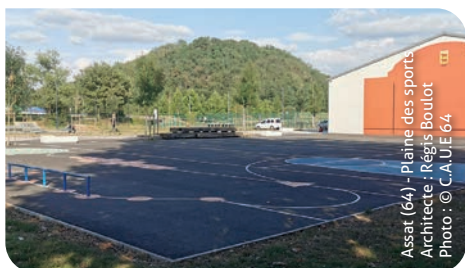
Assat (64) - Plaine des sports Architecte : Régis Boulot