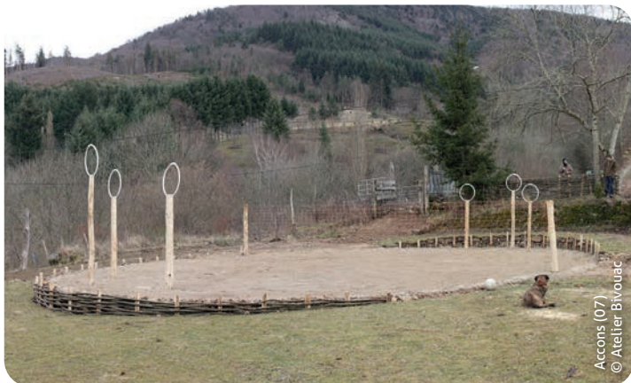
Accons (07)