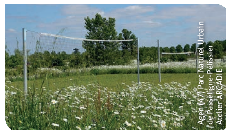
Agen (47) Parc Naturel Urbain de Passéigne-Péussier Atelier ARCADIE