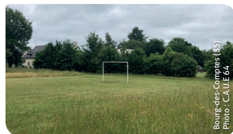
Bourg-des-Comptes (35)