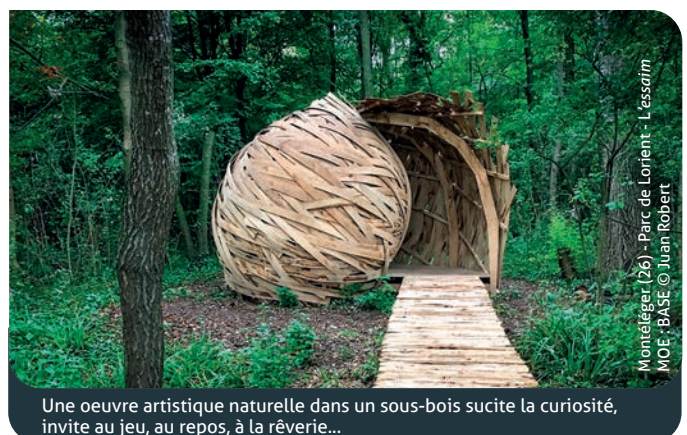
Une oeuvre artistique naturelle dans un sous-bois suscite la curiosité, invite au jeu, au repos, à la rêverie...