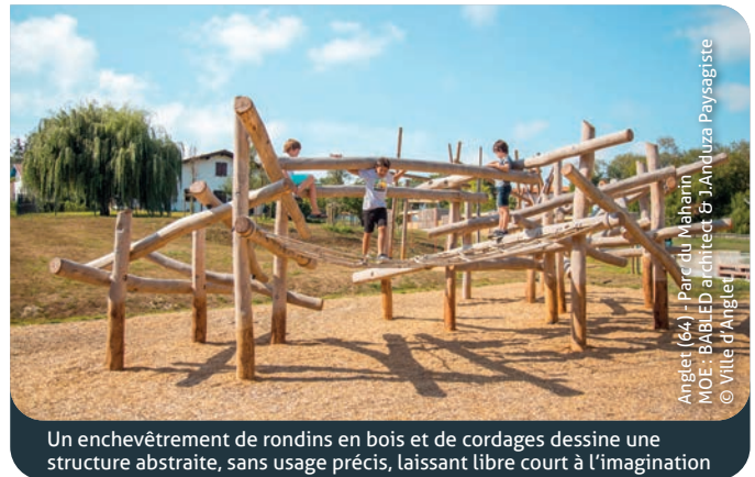
Un enchevêtrement de rondins en bois et de cordages dessine une structure abstraite, sans usage précis, laissant libre court à l'imagination