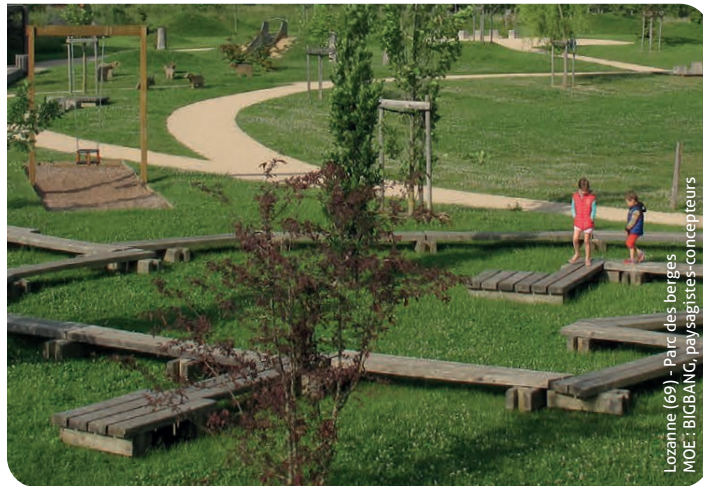
Lozanne (69) - Parc des berges MOE : BLOBBANG, paysagistes-concepteurs