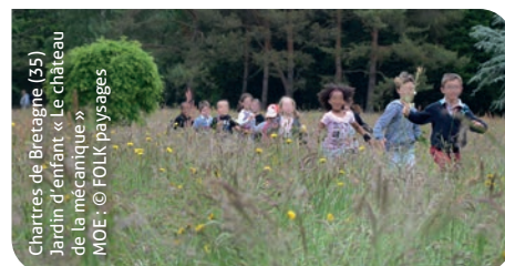
Chartres de Bretagne (35) Jardin d'enfant « Le château de la mécanique » MOE : © FOLK paysages