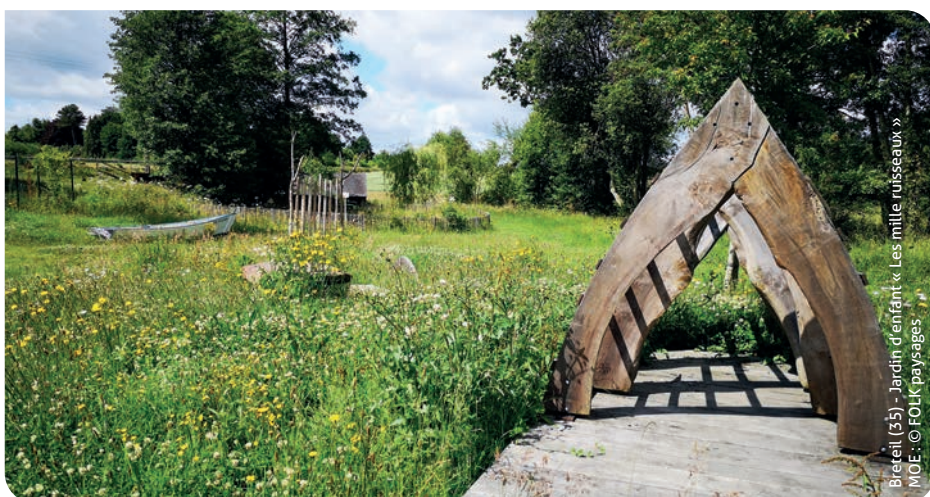
Breteil (35) - Jardin d'enfant « Les mille ruisseaux » MOE : © FOLK paysages