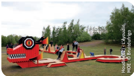
Houdin (62) - L'ayouadin MOE : © Bruidfúringo