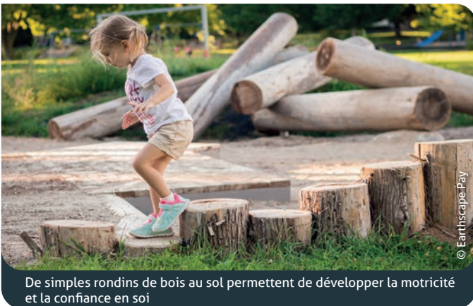
De simples rondins de bois au sol permettent de développer la motricité et la confiance en soi