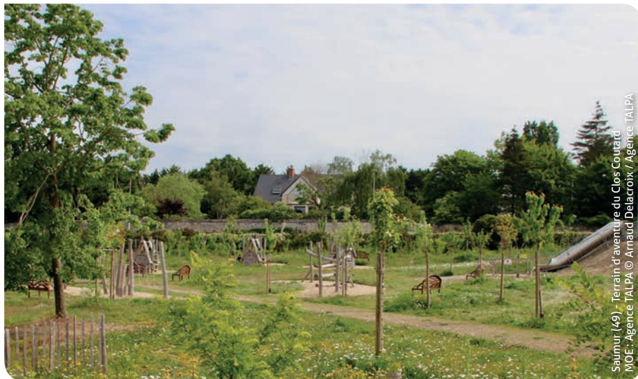
Saumur (49) - Terrain d'aventure du Clos Courard MOE : Agence TALPA