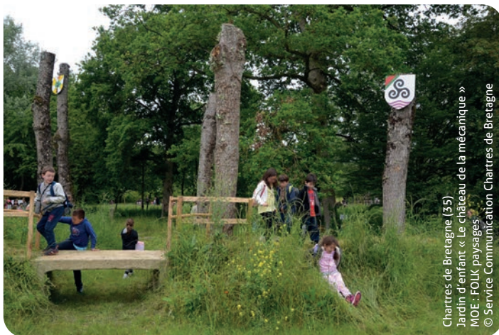
Chartres de Bretagne (35) Jardin d'enfant « Le château de la mécanique » MOE : FOLK paysages