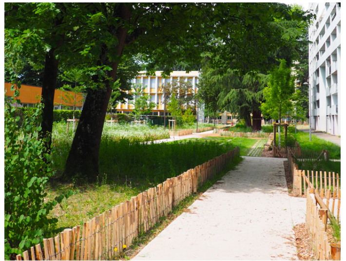
▲ Continuité piétonne paysagère de 1,7 km permettant de relier logements et équipements dans un cadre végétal