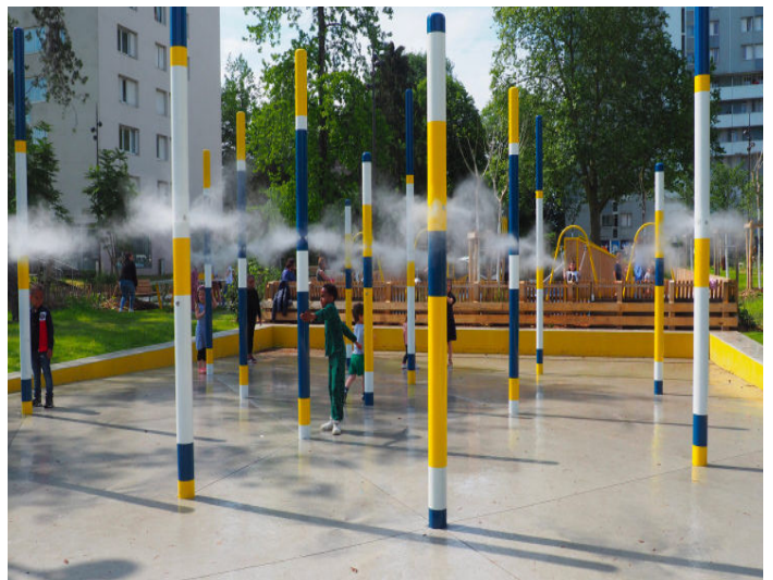
▲ Mâts à déclenchement manuel de brumisation pour jouer et se rafraîchir