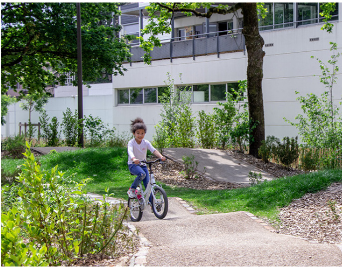
▲ Le parcours évolue et se déploie entre les espaces végétalisés

▲ Du mobilier multi-usages et support de convivialité, grandes tablées et ombrière au coeur d'un écrin de verdure