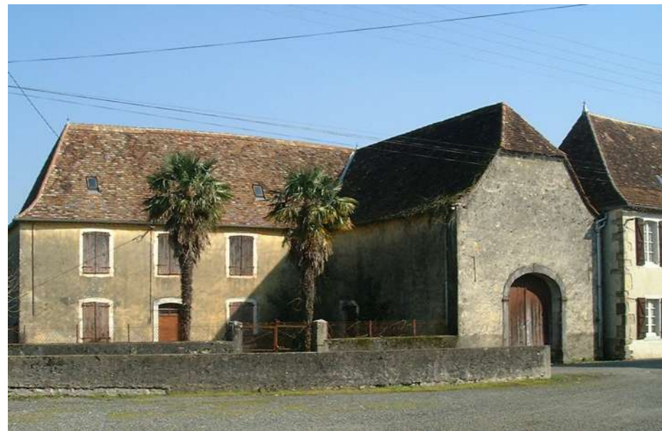
▲ Lorsque les pignons s'alignent sur la rue, un muret en galets ferme alors la cour et assure la continuité bâtie.

Aus borgs, sustot dens los vilatges de l'arribèra deu Gave, lo bastit qu'ei sarrat. Los bastiments que son implantats a l'alinhamment continu sus la carrèra e que son sovent tòcatoquents dab la propietat vesia. Los davants que son traucats de pòrtas carretèras qui s'alandan generalement suus casaus de la part de darrèr. Los ostaus de vilatge que son l'element mei present dens lo paisatge urban. D'ua empresa mei redusida que las bòrdas, qu'alinhin tanben lo lor davant de carrèra dens lo perlongament de las construccions vesias.