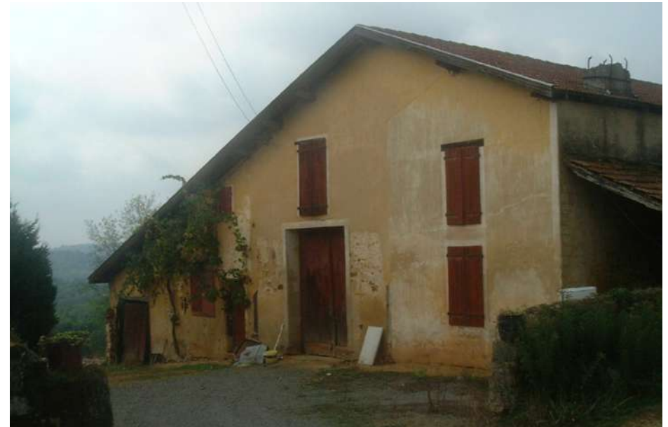
▲ La ferme bloc ouvre sa large façade sur la cour.

Ua varianta, adaptada a l'arquitectura «classica» de Bearn, que consisteish a har ensequir demorança e activitats agricòlas devath un teit continu. Quan ei plegat en escaire, l'ensemble que dessenha alavetz ua parquia petita.