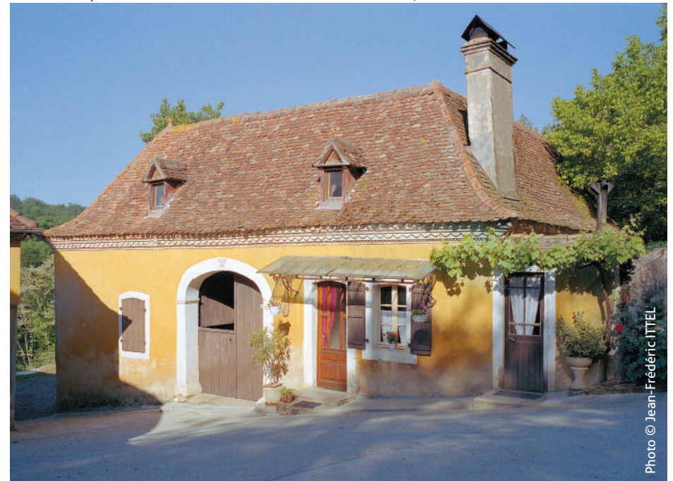
Abitacion e activitats agricòlas que son acesadas devath un medish teit long de teulas planèras.