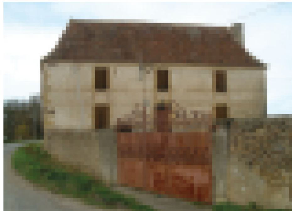
▲ Les bandeaux dessinés dans l'enduit recomposent la façade.

Suus ostaus de teit de teula planèra, la transicion enter lo desbòrd de teit e lo haut de la murralha qu'ei sovent hèita per ua cornissa. Ací, qu'ei hèita de teula cavas e qu'ei aperada « teulamolat ». Lo teulamolat qu'ei ua salhida formada en principi per ua, bèths còps duas o tres arruas de teulas cavas suberpausadas a l'estrem de la paret. Qu'ei un motiu decoratiu qui jòga dab l'ombra e la luz. Au grat deus maçons, la teula que's pòt presentar dab la soa fàcia concava o dab la soa fàcia convèxa. A còps tanben, las duas que's mesclan dens un medish teulamolat. Sovent, lo teulamolat qu'ei soslinhat d'un bandèu de perbòc mei espès, o mei simplament d'un cauceatge.