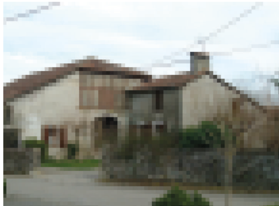
▲ Au XIX e s., un nouveau logis a été construit contre la façade de la ferme d'origine. Au sègle XIX au , ua demorança navèra qu'ei estada bastida contra lo davant de la bòrda purmèra.

La travada centrau, quilhada de com cau, qu'ei hèita de duas alas qui s'allongan en un penent doç. La cloca, que poderé estar descrivuda com ua adaptacion deu plan basco-landés a la teula picon.