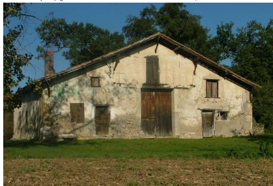
Bòrda dab davant penon.