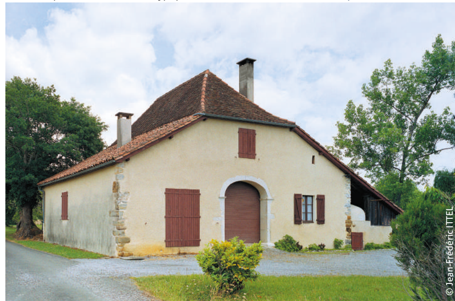
La cloca : ua heitura atipica.