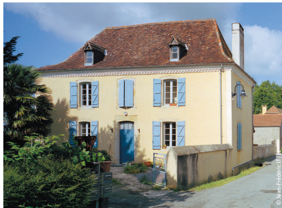
▲ Corps de logis à façade gouttereau.

L'esperon de la teula planèra o « teula picon » que permet d'arrapar la teula aus listèths e donc de conservar la carpenta plan en penent deus teits de talabena qui cobriuan las construccions « pirenencas » purmèr. Au contra, desprovedida de fixacion, shens poder tièner Soleta dab lor pròpi pes, las teulas cavas que demandan donc teits d'un penent mei doç.